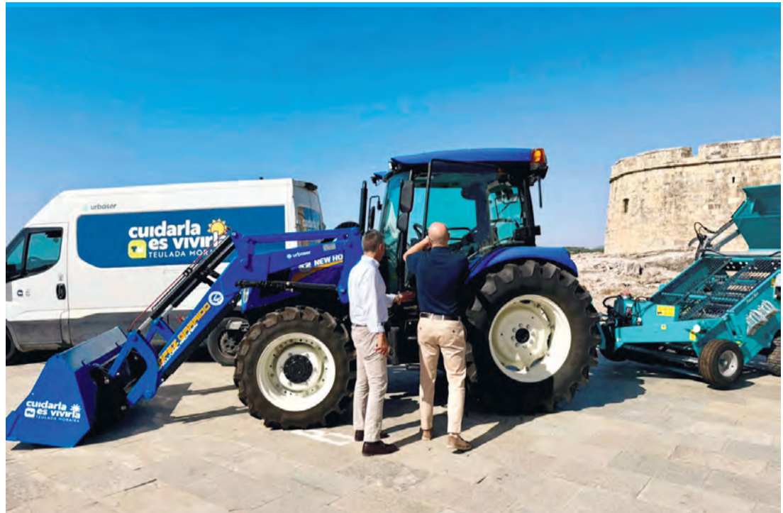
Der neue Fuhrpark wurde publikumswirksam bei Morairas Burg präsentiert.

Ein Traktor mit Siebssystem, „der die Strandreinigung optimieren soll“, so das Rathaus, ist eins der ersten für alle sichtbaren Ergebnisse dieses neuen Vertrags. Dazu kommt eine elektrische Kehrmaschine für die Ortskerne, „die für eine effiziente Säuberung mit weniger Emissionen und Lärm“ gemacht ist, eine Kehrmaschine für die Urbanisationen, „die die Instandhaltung dieser Wohngebiete erleichtern wird“, und ein Inspektionsfahrzeug, um alle