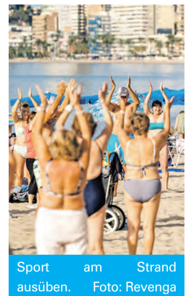
Sport am Strand ausüben.

Alle ab 55 Jahren, die auch nach dem Sommer noch Sport treiben möchten, können sich außerdem ab sofort für ein Zirkeltraining anmelden, das ab Oktober dienstags auf dem Frontón-Platz in Teulada sowie donnerstags im Espai la Senieta, jeweils von 17.30 bis 18.30 Uhr, angeboten wird. Teilnahme 78 Euro, Rentner 25 Euro. Anmeldung entweder in den SIT-Stellen im Rathaus und Espai la Senieta oder online auf der Rathaus-Seite. Infos: ☎ 965 741 001.