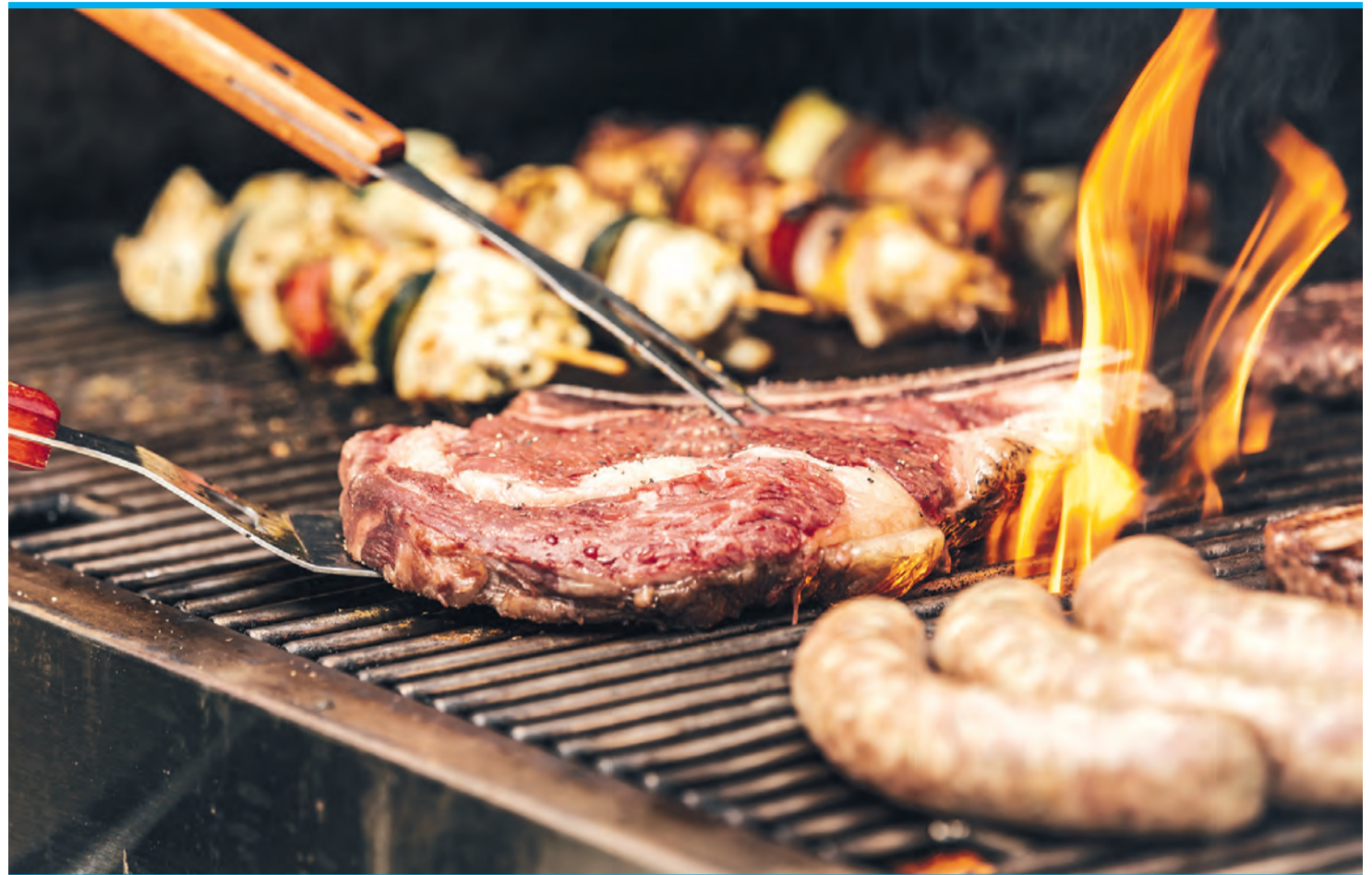
Feuer und Flamme: Die Faszination für das Grillen ist ungebrochen.

In Spanien ist die Rechtslage zum Grillen im Freien äußerst undurchsichtig und zerklüftet, sowohl was den öffentlichen, als auch was den privaten Raum betrifft. Aus naheliegenden Gründen des Feuerschutzes in diesem in großen Teilen staubtrockenen Land, ist das Ent-