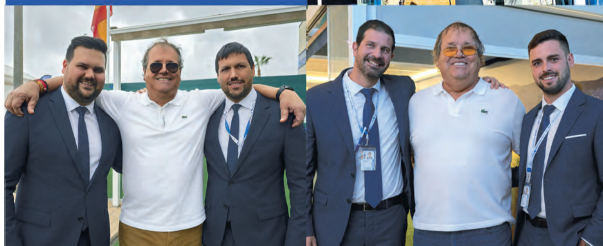
Technisches Team von Toldos Guardamar

Willkommen zu einem ganz neuen Erlebnis bei Toldos Guardamar.