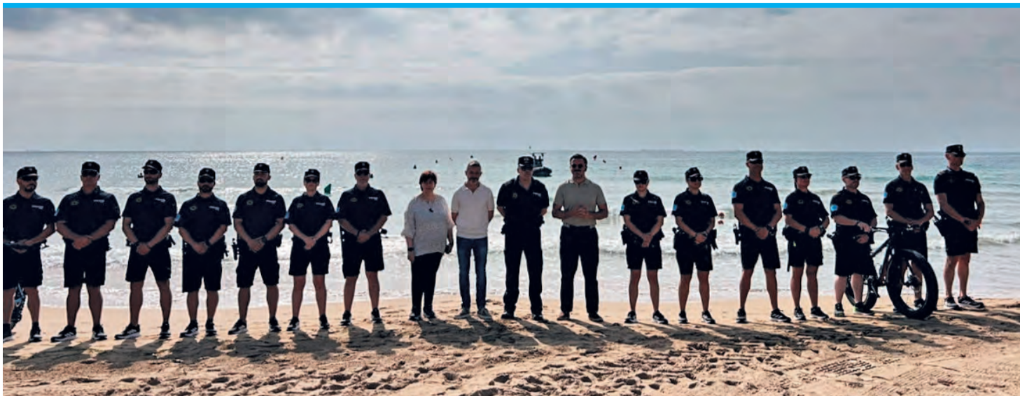
Die Beamten der Einheit Grumat wurden an der Playa La Marina in Elche vorgestellt.