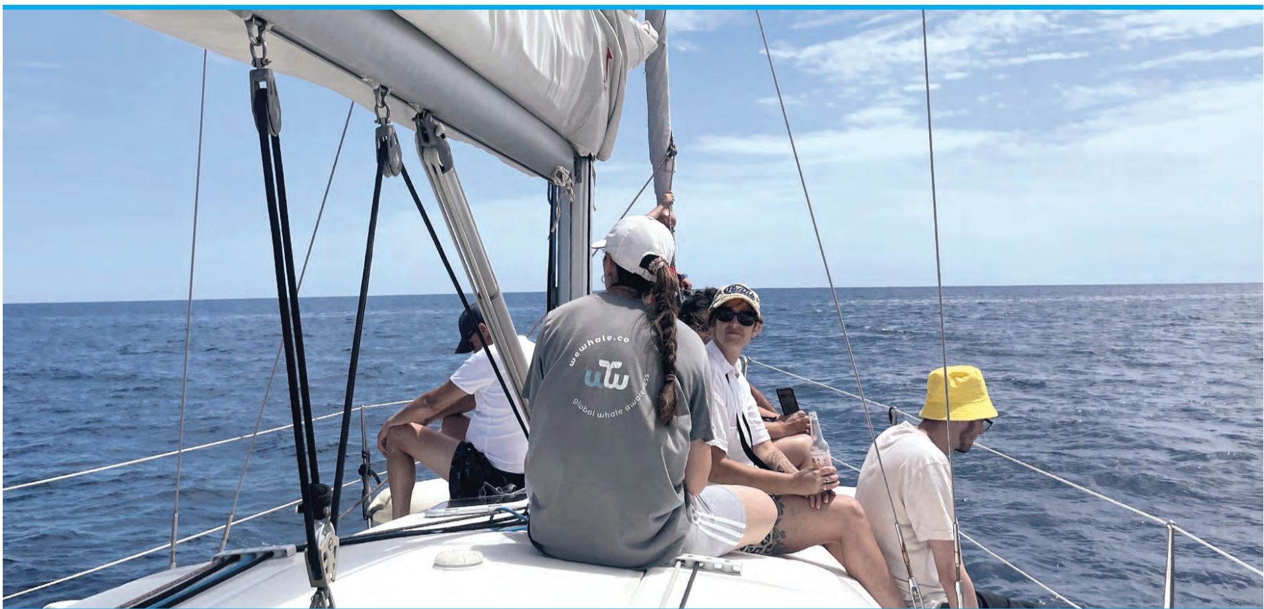
Meeresforscherin O'Flaherty über Mensch, Tier und Küstenschutz auf der „Som Mar“