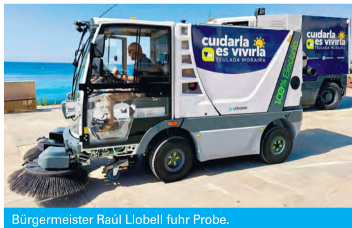
Bürgermeister Raúl Llobell fuhr Probe.

„Cuidarla es vivirla“ (Die Stadt zu pflegen heißt, sie zu erleben) – unter dieses Motto hat das Rathaus die neue Stadtreinigung gestellt. Der Vertrag mit Urbaser sieht vor, dass innerhalb der kommenden sechs Monate weitere Gerätschaften und technische Neuerungen eingeführt werden.