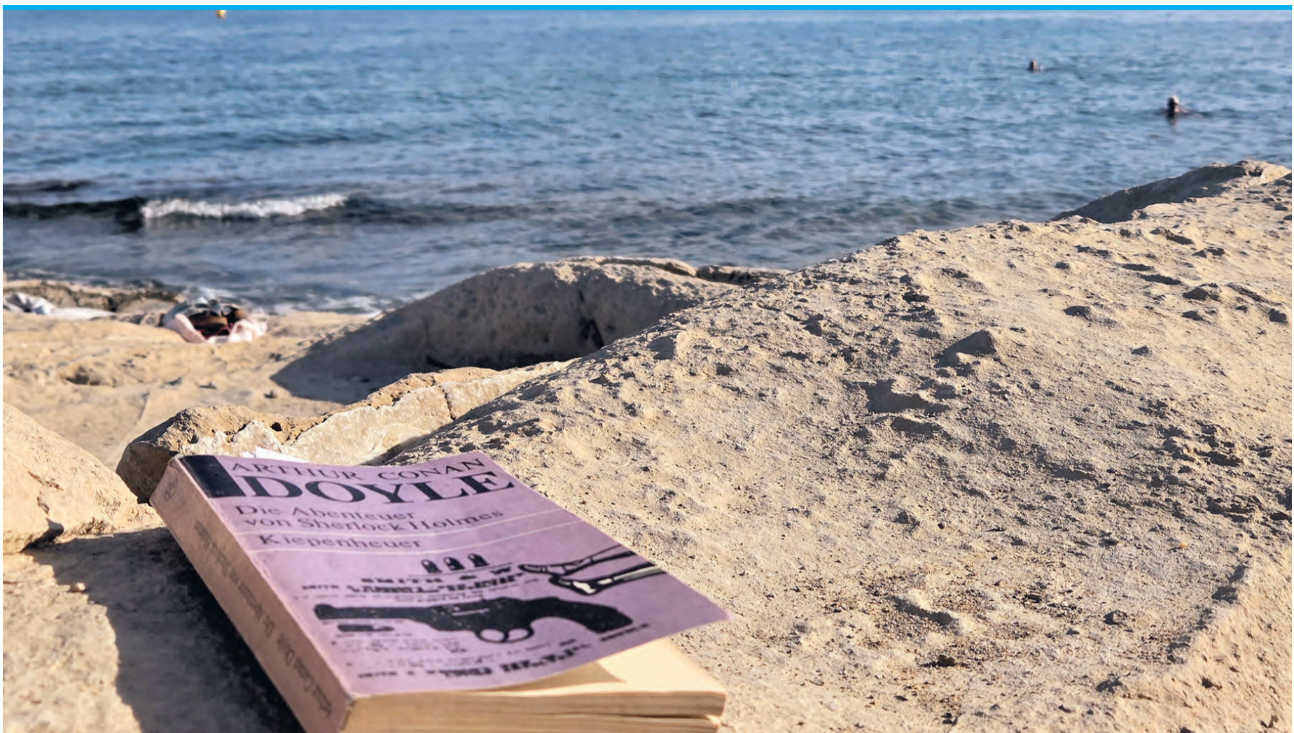
Am Strand kommen sowohl Lese- als auch Wasserratten voll auf ihre Kosten.