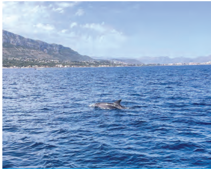
Tümmeler und Finnwale an Dénias Küste beobachten.

Das Wasser wirkt im direkten Kontrast zu der felsigen Umgebung kristallklar. Taucht man wenige Meter vom Ufer entfernt unter, eröffnet sich eine Welt, die man bei dem ganzen Trubel am Strand nicht erwartet hätte: Zahlreiche kleine Fischschwärme huschen vorbei, einzelne Seeigel und auch Seesterne klammern sich an