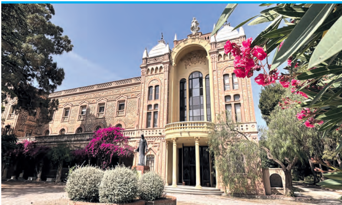
Das Kloster Casa de Ejercicios Espirituales de La Purísima.