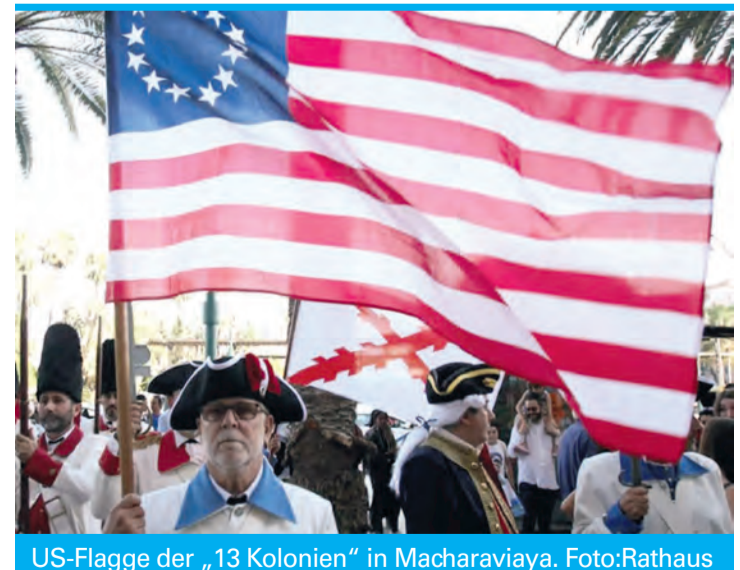
US-Flagge der „13 Kolonien“ in Macharaviaya.

Immerhin lieferte König Carlos III. Waffen und Munition, blockierte die Armada aktiv britische Häfen und brachte Schiffe auf. Freilich nicht, weil der Bourbonne ein Republikfan war, sondern schlicht aus dem Kalkül, dem Erzfeind Britanien eins auszuwischen, sich