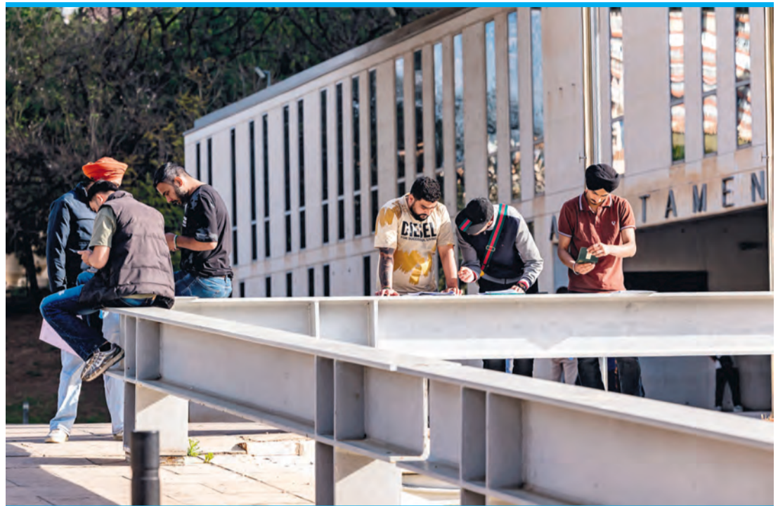
Migranten in Benidorm.

360.000 dieser Anträge sind für ihre Weiterbearbeitung angenommen. Die Glücklichen verfügen schon über eine provisorische Aufenthalts- und Arbeitserlaubnis, in drei Monaten