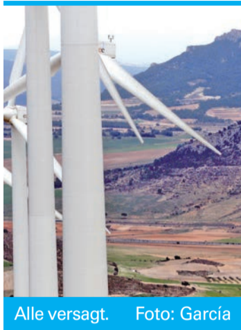
Alle versagt.

Die staatliche Wettbewerbsaufsicht (CNMC) hat den Streit noch einmal verschärft. Mit der Einleitung von 55 Sanktionsverfahren gegen den Stromnetzbetreiber REE, die Stromkonzerne Iberdrola, Endesa und Naturgy sowie gegen weitere Akteure bis hinunter zu einzelnen Kraftwerken will die Marktaufsicht zu klären versuchen, wer am 28. April was falsch gemacht hat. Im