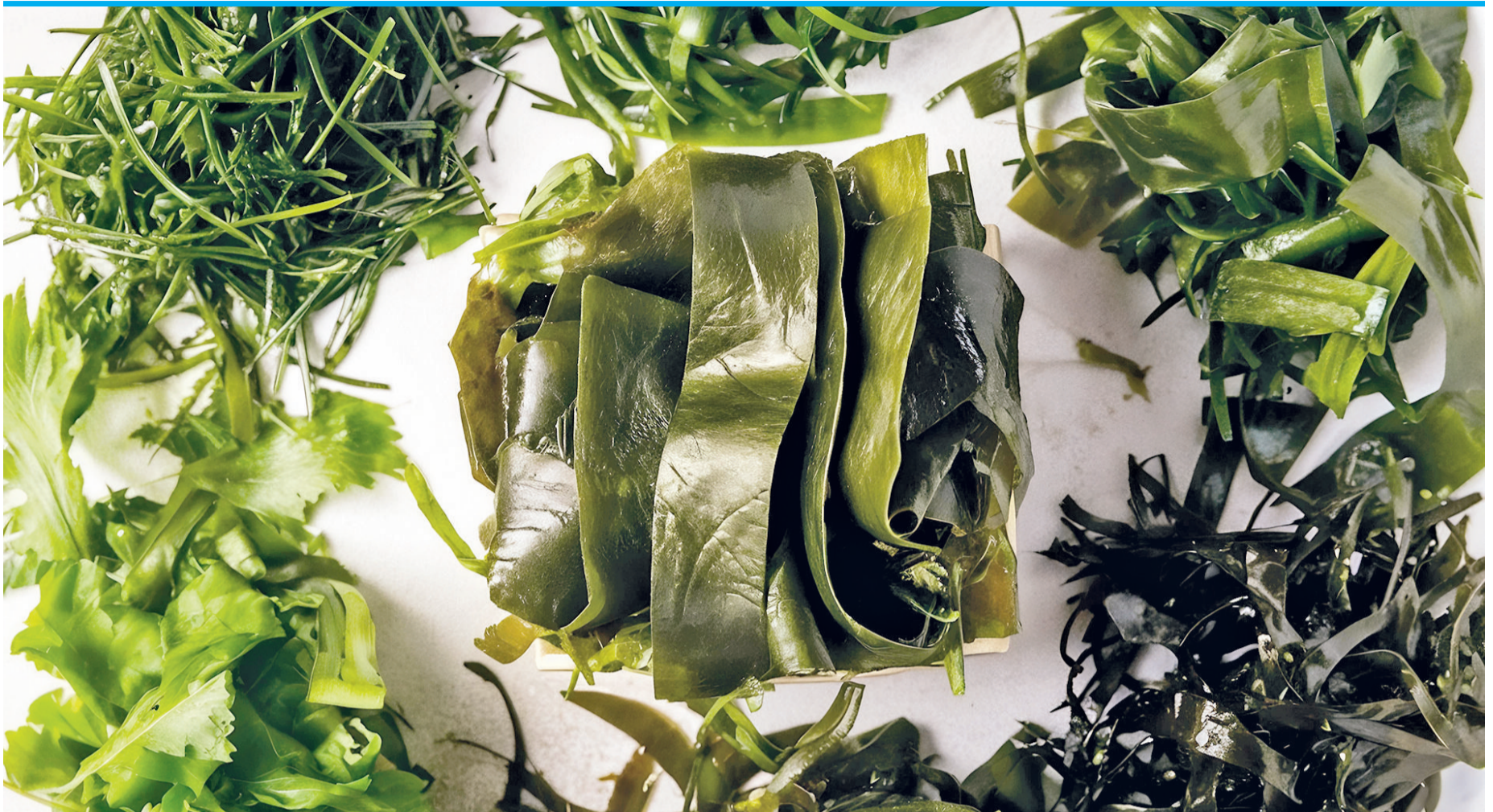
Das grüne Gemüse gibt es in vielen verschiedenen Varianten.