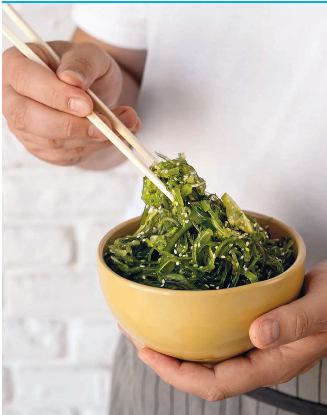
Algen lassen sich auch hervorragend als Salat verarbeiten.

delikates Aroma. Die Rotalge kann nach kurzem Einweichen roh gegessen werden. Sie hat eine lange Tradition in Irland und Schottland.