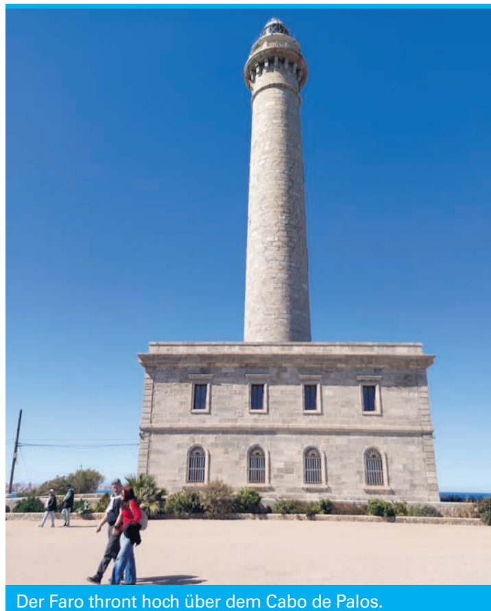
Der Faro thront hoch über dem Cabo de Palos.

Wer dem Rad- und Wanderweg im Anschluss etwa einen Kilometer lang weiter folgt, landet an den breiten Sandstränden des Naturparks. Außerhalb der Hochsaison kann man mit dem Auto auch direkt vor Ort parken. Am weitläufigsten ist die Playa Calblanque: Auf der rechten Seite noch von den Ausläufern der versteinerten Dünen eingerahmt, bietet sie einen breiten, satt goldfarbenen Sandstrand mit einfachem Einstieg ins Wasser. Nur wenige Minuten Fußmarsch sind au-