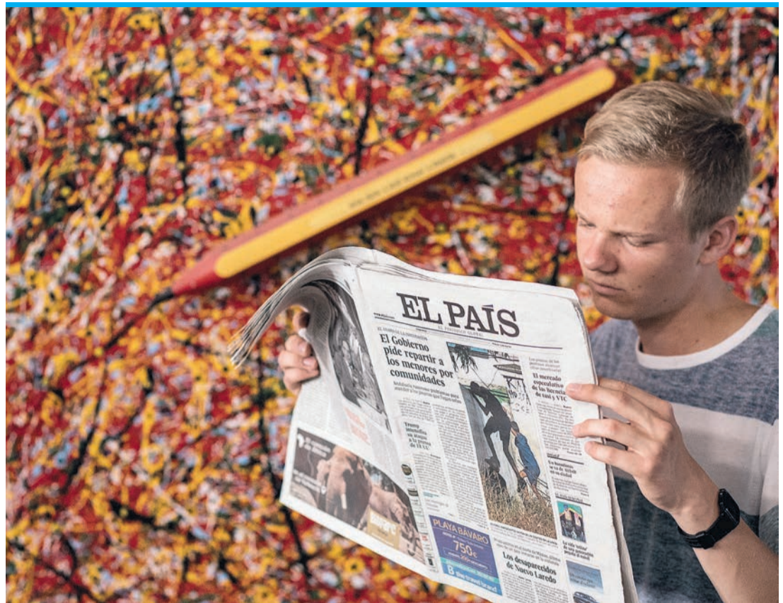
Wichtiger Hüter der spanischen Demokratie: „El País“

Die Zeitung erklärt in einem Editorial: „El País hat sich seit der Geburtsstunde dem Dienst am Leser verschrieben, nicht einer Macht, einer Partei, einer Regierung oder irgendwelchen Interessen“. Die Zeiten haben sich geändert, nicht jeder Leser würde das heute nach 50 Jahren noch unterschreiben. Die