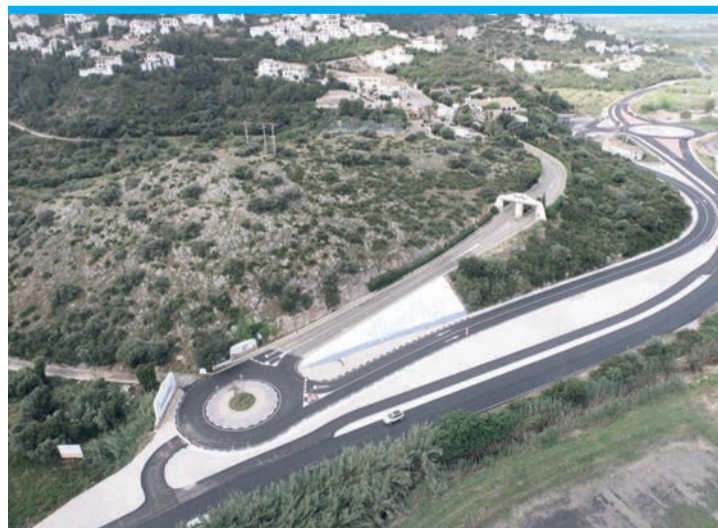
So sieht die neue Verkehrsführung von oben aus.

Pego – at. Nur noch wenige letzte Details, dann gibt es auf der Straße CV-700 zwischen Pego und El Verger wieder freie Fahrt. Die Straßenarbeiten, die einen Unfallsschwerpunkt beseitigen und für mehr Sicherheit sorgen sollten, unter anderem an der Einfahrt der Urbanisation Monte Pego, sind mit einigen Monaten Verspätung so gut wie abgeschlossen. Eigentlich war Februar als Ende angepeilt