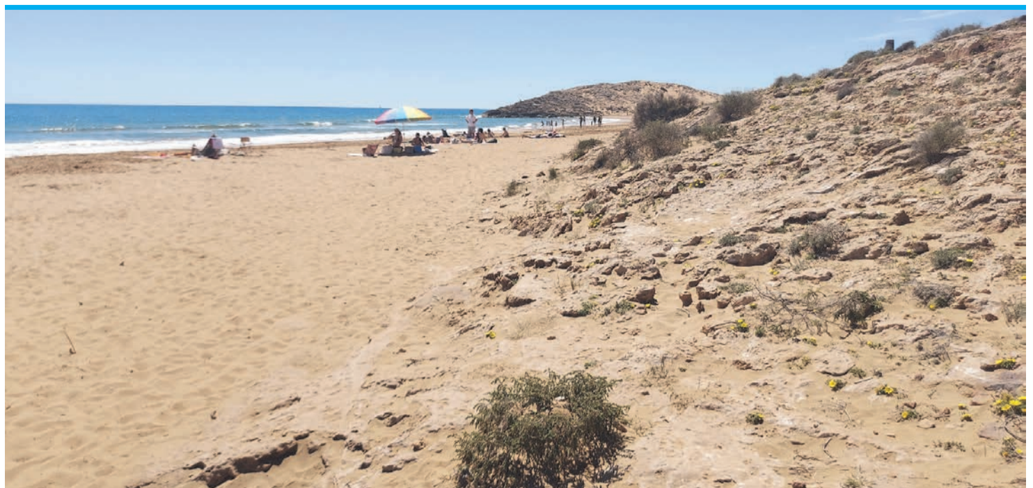
Die Playa Calblanque bietet weite, goldene Sandstrände, eingerahmt von versteinerten Dünen.

Der Pfad verläuft oberhalb dreier abwechslungsreicher Buchten, bis er schließlich in die Cala Reona am Rand des