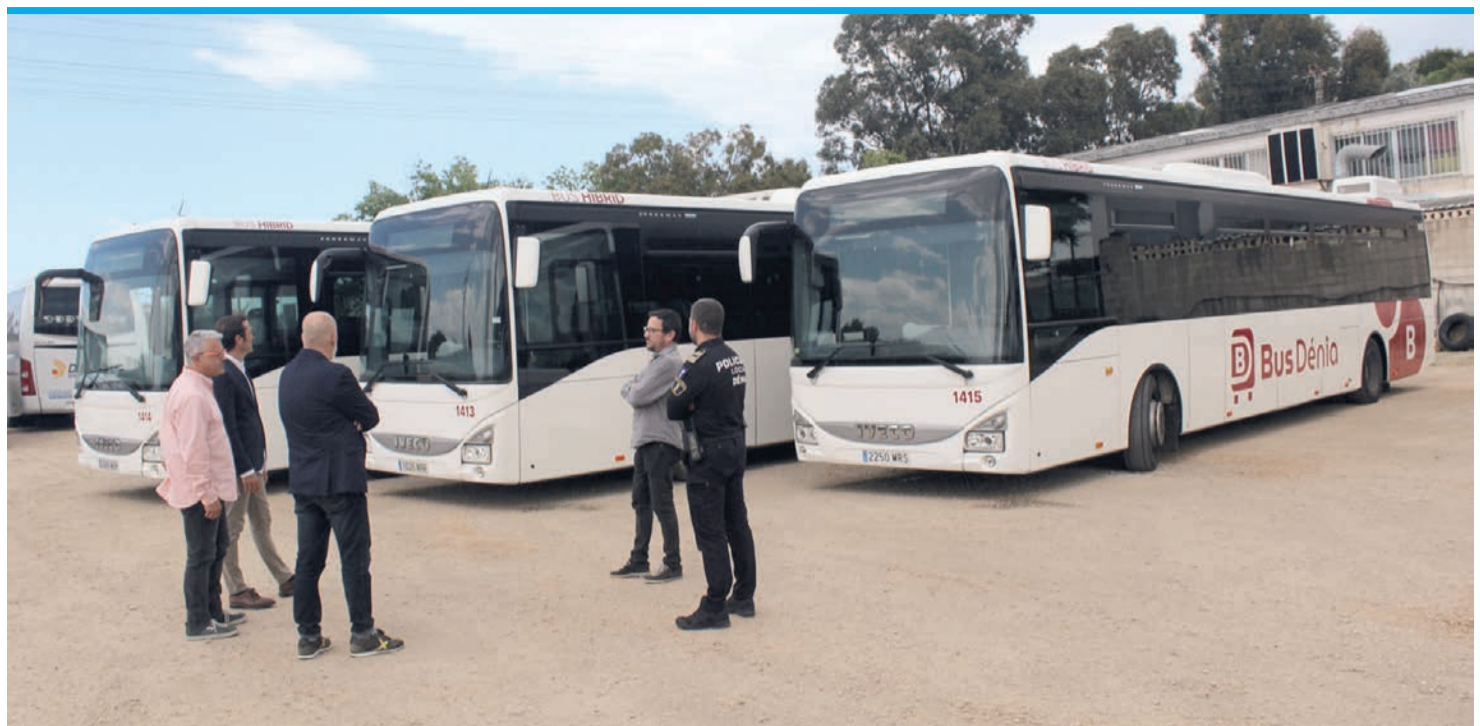
Die neuen Stadtbusse sind in Dénia eingetroffen.

Teulada-Moraira – at. Teuladas neuer Müllvertrag mit Urbaser ist am 5. Mai in Kraft getreten. Das Unternehmen ist ab sofort für Müllabfuhr, Straßenreinigung und Instandhaltung von Stränden zuständig. Nach und nach sollen neue Fahrzeuge und Container eingesetzt sowie Verbesserungen am Wertstoffhof vorgenommen werden.