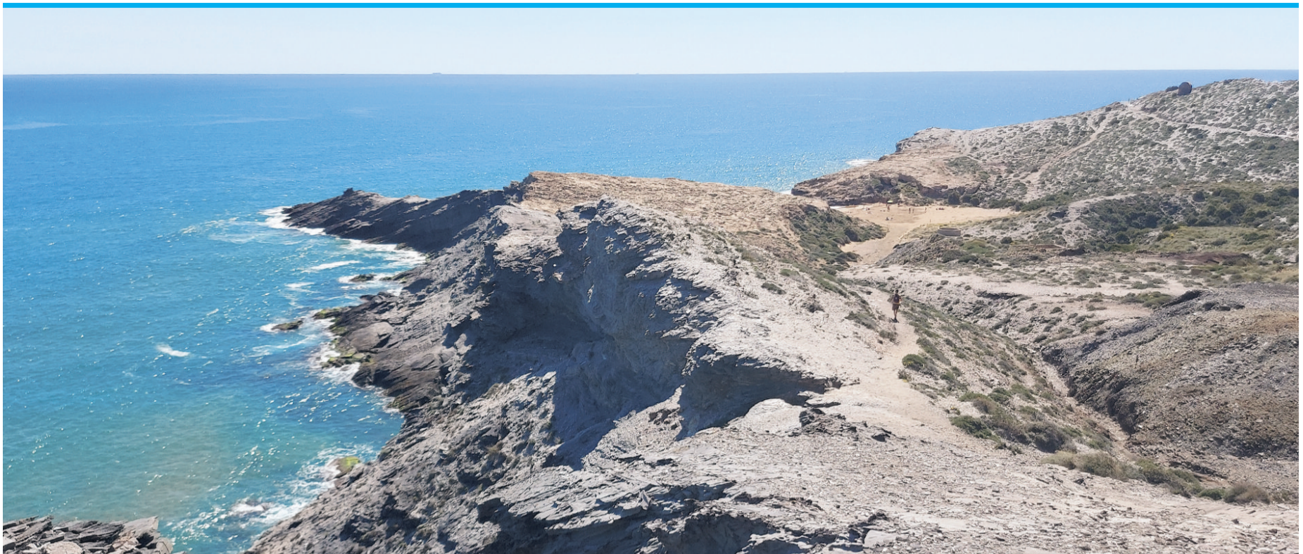
Im Parque Regional de Calblanque treffen dunkelgraue Schieferklippen, türkisfarbenes Meer und goldene Strände aufeinander.