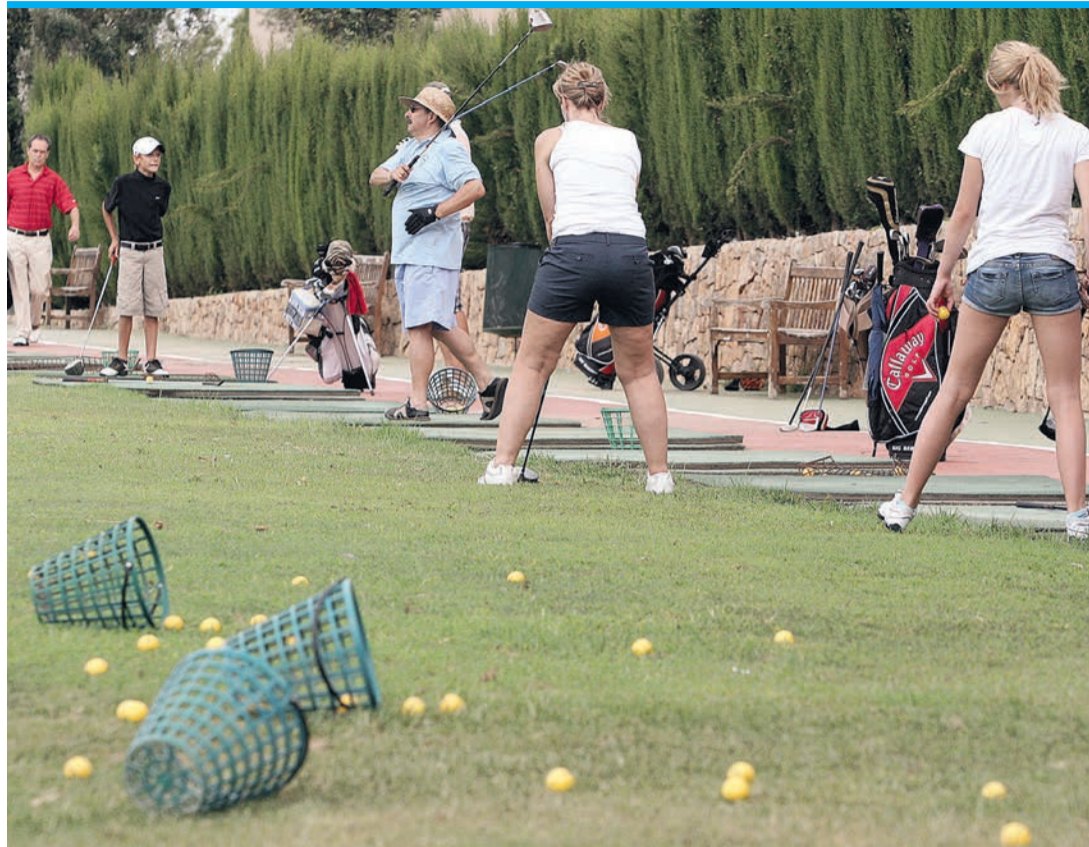
Beim Üben wird schon mal ein Ball verschlagen. Die Sammler freut's.

Auf dem Golfplatz Campoamor in Orihuela Costa ist der Abschlag auf Bahn 5 interessant für Sammler. An dieser Stelle nah an der Straße zwischen San Miguel de Salinas und Orihuela Costa landen viele Bälle in der Schlucht Barranco del Lobo oder im Flussbett des Nacimiento. Zum Glück für die Brüder, die dieser Tätigkeit schon seit 28 Jahren nachgehen, geht kaum ein Golfer los und sucht seinen Ball. Lieber kauft er ei-