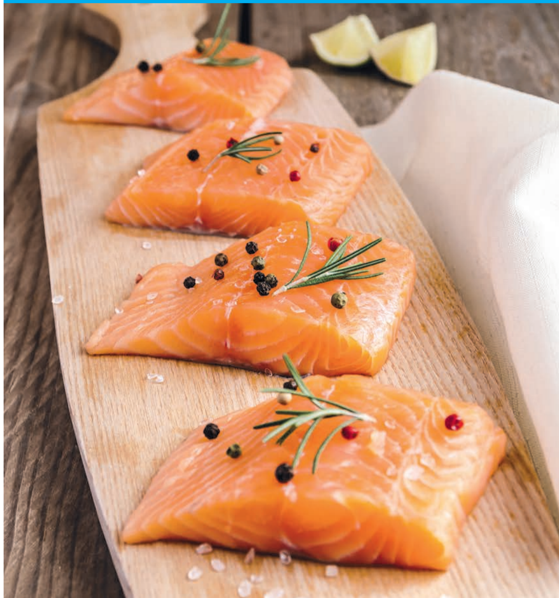
Hochwertige Proteine machen den Lachs zur gesunden Mahlzeit.

Heute hat der größte Teil der auf unseren Märkten feilgebotenen Lachse niemals einen Fluss gesehen. Sie sind stattdessen in skandinavischen, irischen oder schottischen Fischfarmen groß geworden. Doch der in den 1970er Jahren mit umstrittenen Futterzusätzen erzeugte Zuchtlachs hat dem Image der ehemaligen Nobeldelikatesse deutlich geschadet. Die Massentierhaltung in Käfigen machte den einstigen Edelfisch zum so genannten Brathähnchen unserer Tage – und mittlerweile für jedermann erschwinglich.