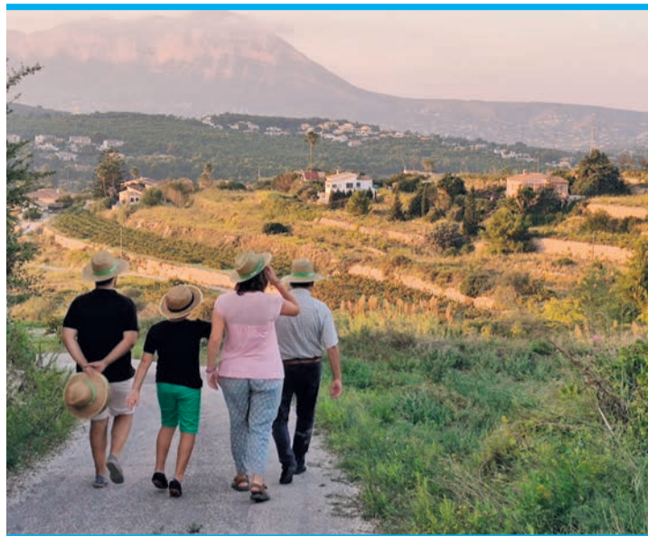
Spaniens Tourismus profitiert von Krise.

Die Analyse hat ferner ergeben, dass im März Gäste aus Europa das Ausgabenminus von Touristen aus Asien mehr