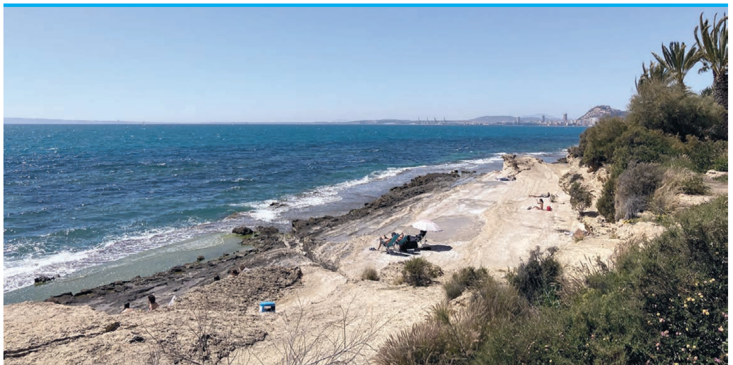
Die Bucht Cala Cantalar ist ein echter Ruhepol für Menschen, die dem Trubel der Stadt entfliehen wollen.

weichen die Steine weißem Sand. Ab hier zeigen sich wieder die typischen Züge eines touristischen Strandes: Badegäste auf bunten Handtüchern, Mütter, die ihre Kinder zum Eincremen ermahnen, und Beachvolleybälle, die durch die Luft fliegen. Zwischen Albufereta und dem Cabo de las Huertas gelegen, ist dieser Küstenabschnitt oft die erste Wahl der Einheimischen.