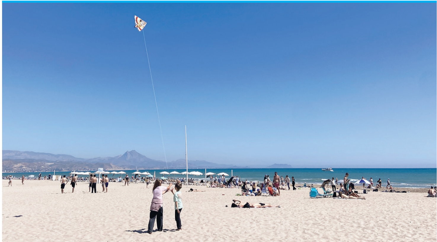
Ein Meer aus Sand: Die weitläufige Playa de San Juan gilt als das sonnige Aushängeschild der Stadt.

Anhand der Menschenmas- sen, die sich ihren Weg vom Auto zum Sand bahnen, lässt