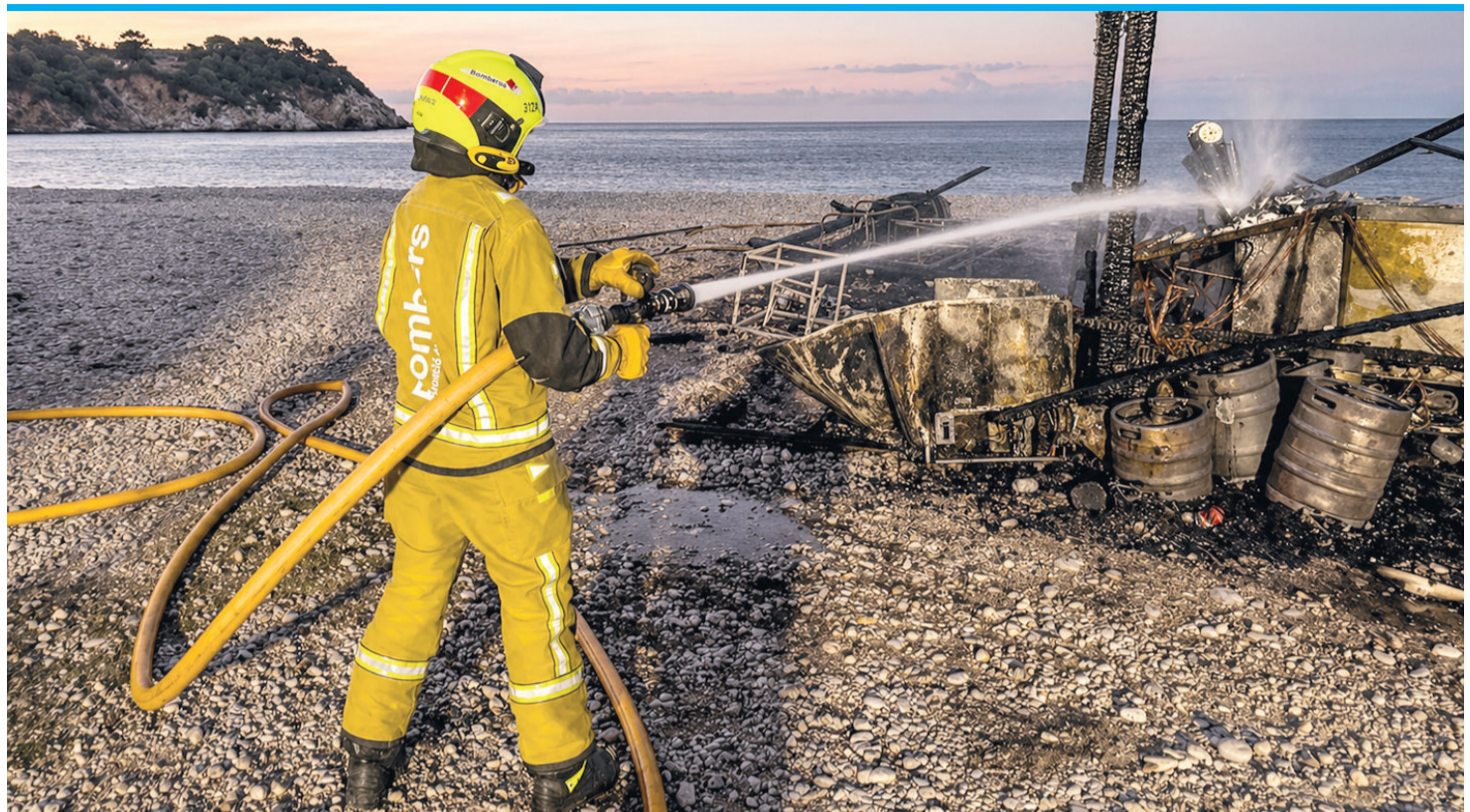
Die Feuerwehrleute löschten den Brand des beliebten Chiringuitos im Pueblo Mascarat.

Alicante – mar. Es gibt kaum einen Alicantiner, der nicht die Horchatería Azul in der Calle Calderón kennt. Wenn dort die eisige, selbstgemachte Erdmandelmilch mit den Fartons zum Einditschen verkauft wird, startet der Sommer. 1930 eröffnete der winzige Laden mit den markanten blauen Kacheln, im Vorjahr verstarb 99-jährig die Tochter des Gründers. Nun fanden die elf Urenkel eine Lösung, um den Laden weiterzuführen. Am 1. Mai war Wiedereröffnung – und damit Sommer.