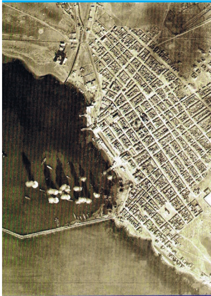
Bomben auf Torreviejas Hafen 1938.