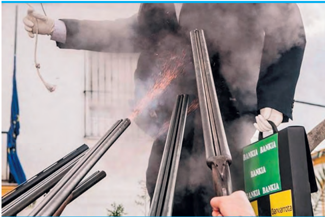
2008 brannte in El Burgo ein Banker, 2026 Netanyahu.

Sie führt aus: „Wir haben auch schon Putin, Osama bin