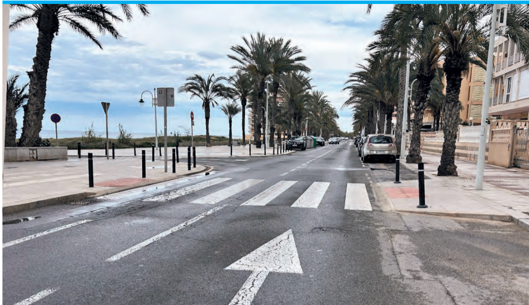
Die Einbahnstraßenlösung in Arenales del Sol sorgt für Ärger.

Einzelhändler und Gastwirte sind sauer, weil ihnen die Hälfte