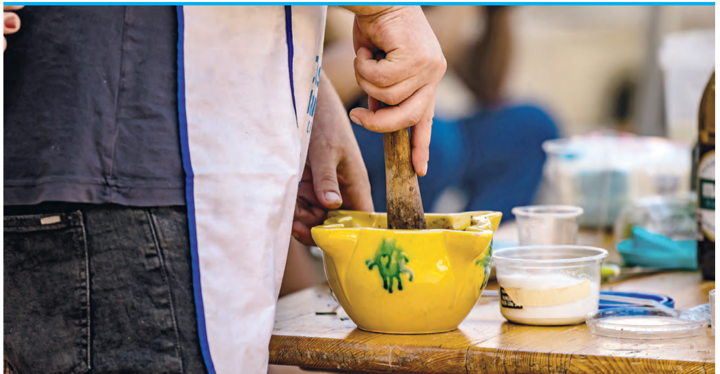
Gehört zu jeder Paella im Familienkreis: Selbstgemachtes Alioli aus Unmengen Knoblauch.

Nach getaner Arbeit ist die Reisschicht in der Pfanne gerade mal einen Zentimeter hoch.