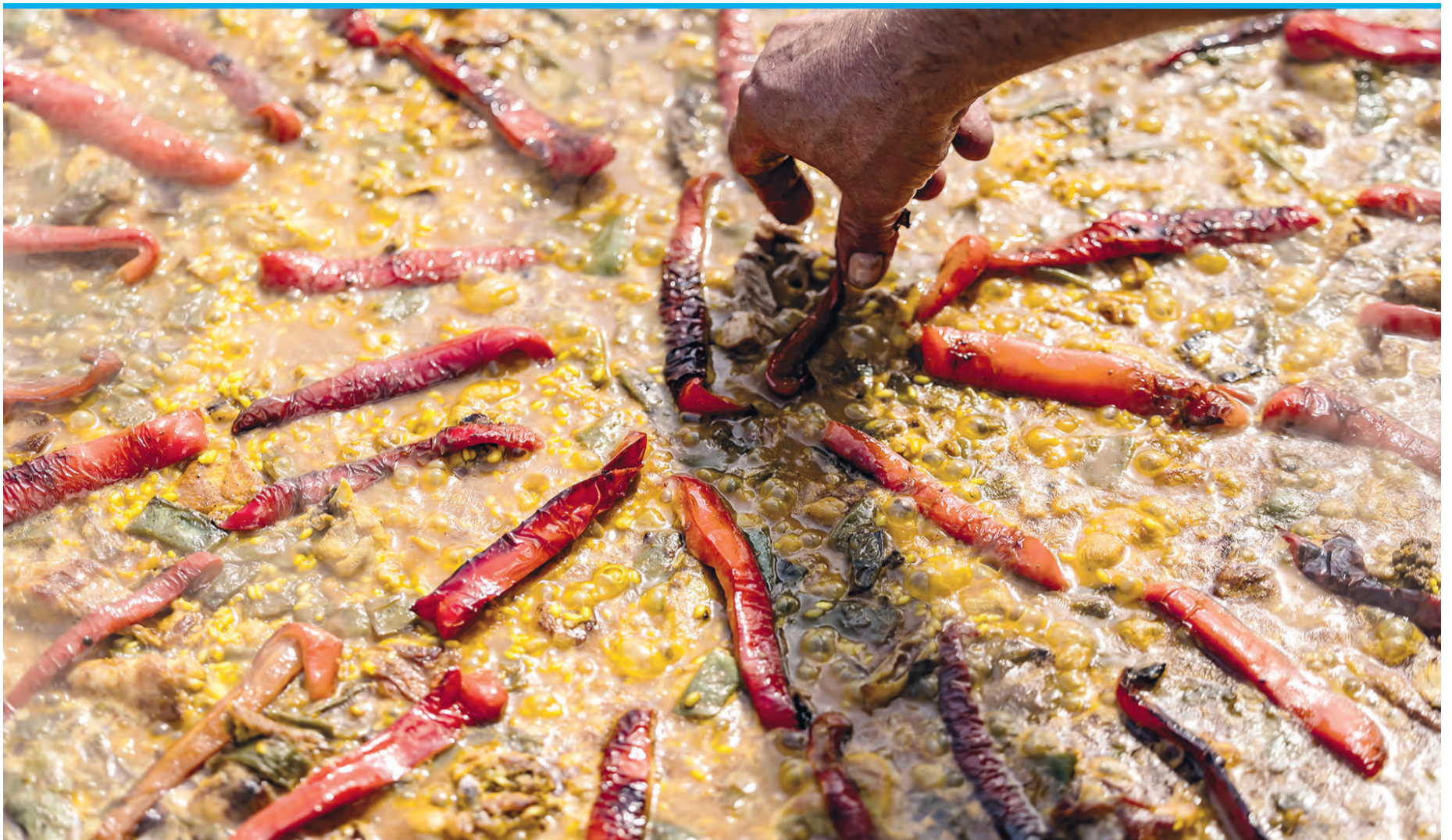
Eine echte Paella gehört sonntags mittags auf den Familientisch – und auf jede Dorffiesta sowieso.