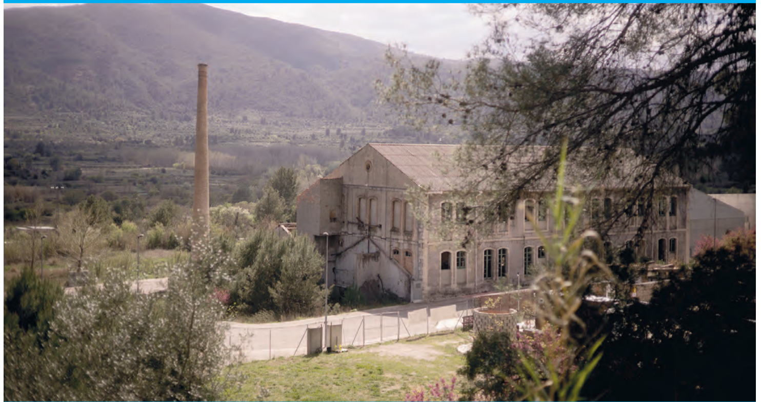
Entlang der Strecke stehen noch einige alte Industriegebäude.

Kurve folgt auf Kurve, und der Blick bleibt konzentriert auf der Straße. Doch die Mühe lohnt sich. Die Fahrt wirkt fast wie eine kleine Abenteuersafari durch die Berge, nur dass statt Tieren links und rechts Olivenbäume, Felsen und Terrassenhänge auftauchen. Wenn der höchste Punkt erreicht ist, zieht sich die Straße in langen Kurven wieder den Hang hinab und mit jeder Kurve öffnet sich der Blick