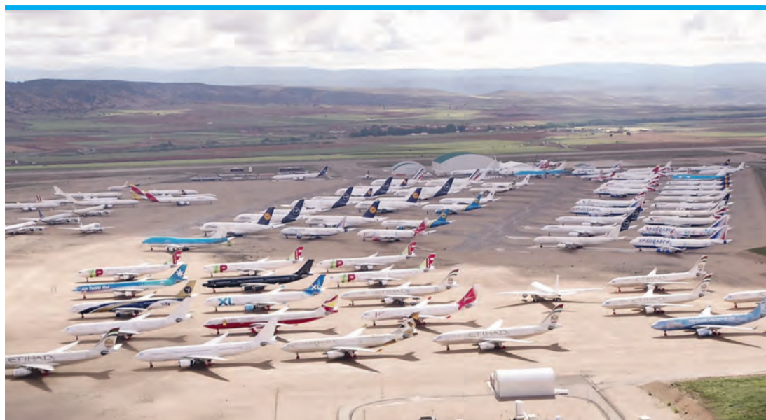
Teruel bietet Airlines wieder Schutz.