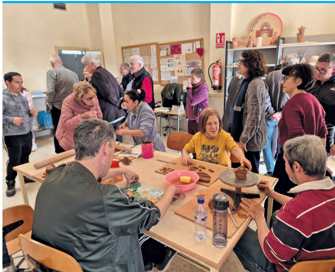
Der Lions-Club hat den Verein Aprodeco in La Xara besucht.

In eigens dafür ausgestatteten Räumen lernen Menschen im Alter von 18 bis 70 Jahren, sich nicht nur in einem Haushalt zurechtzufinden, zu kochen und die tägliche Hausarbeit zu organisieren, sondern erfahren in gut ausgerüsteten Werkstätten das praktische Arbeiten mit