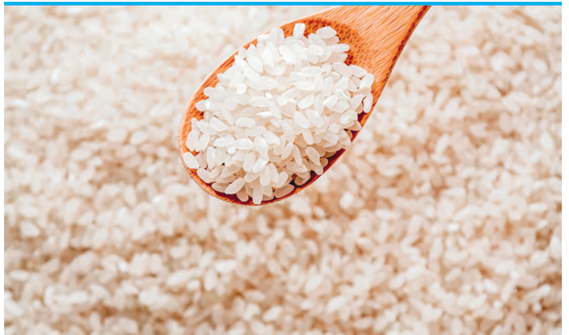
Für die Paella eignen sich nur bestimmte Reissorten.