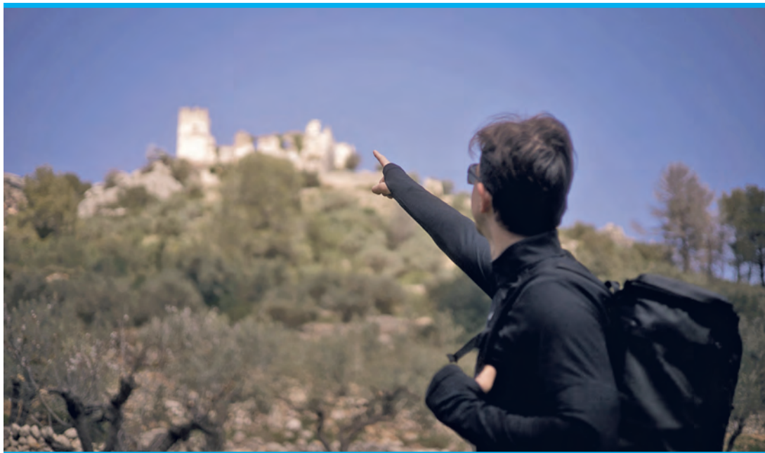
Über dem Tal liegen die Ruinen des Castillo de Perputxent, einer Burg aus der Maurenzeit.

Direkt unterhalb der Burg beginnt ein breiter Weg aus Schotter und Steinen. Er folgt der alten Bahnstrecke entlang des Flusses Serpis und gehört heute zur Vía Verde del Serpis. In Spanien verlaufen viele solcher Vías Verdes. Das sind ehemalige Eisenbahnstrecken, die später zu Wander- und Radwegen umgebaut wurden. Mehr als 3.000 Kilometer dieser Wege gibt es inzwischen im ganzen Land. Die Strecke im Serpis-Tal ist ein Teil davon. Früher fuhr hier Züge zwischen Gandía und der Industriestadt Alcoy im Hinterland, sie verbanden den Hafen an der Küste mit den Fa-