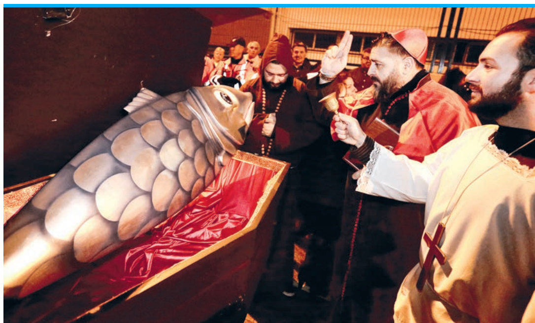
Das Begräbnis der Sardine beendet das närrische Treiben an Aschermittwoch.

Highlight für alle Pegoliner ist die düstere Straßenkarnevalsparty, La Pinyata, am 21. Februar. Um Mitternacht beginnt der Umzug auf dem Rathausplatz, danach wird die Nacht durchgefeiert. Um 2 Uhr sorgen Funkenläufer (Correfocs) für Stimmung – denn ohne Pyrotechnik geht auch an Karneval nichts.