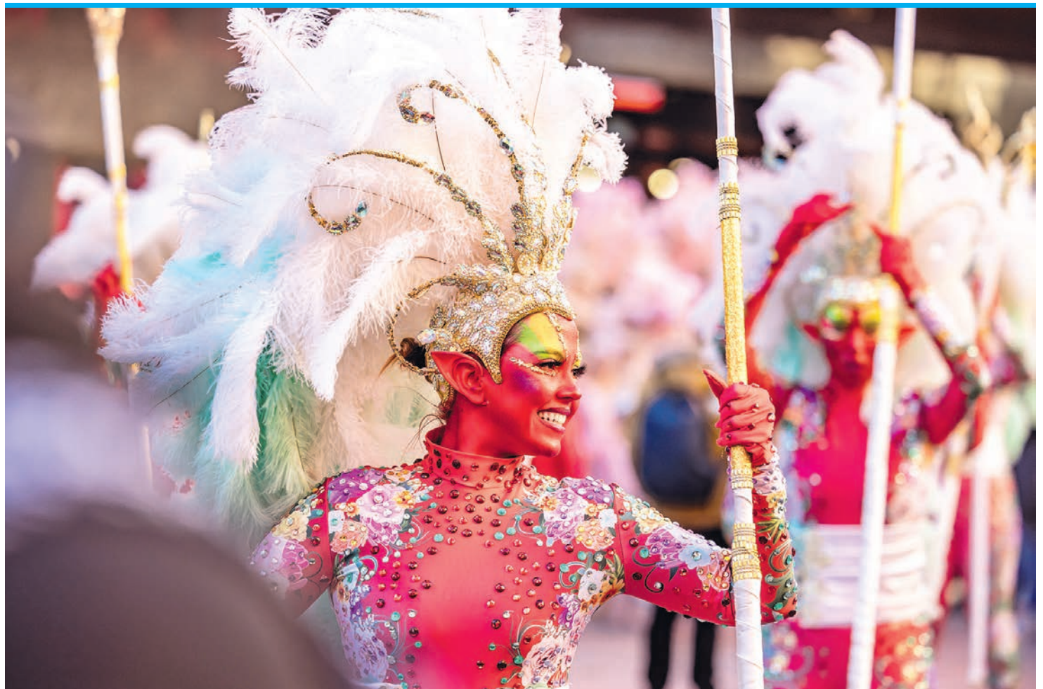
Torrevieja feiert Karneval mit bunten Kostümen und vielen Tänzern.

Eine andere Theorie besagt, dass einst nicht Sardinen verbuddelt wurden, sondern Schweinebauch-Fleisch (panceta). Dieses war in der Fastenzeit verboten, und man nannte die einzelnen Scheiben „Sardinen“. Die dritte Antwort auf die Frage nach dem Ursprung hat man in Murcia gefunden. 1851 organisierte eine übermütige Studentengruppe einen Begräbniszug zu Ehren einer Sardine, die im Anschluss verbrannt wurde. Die