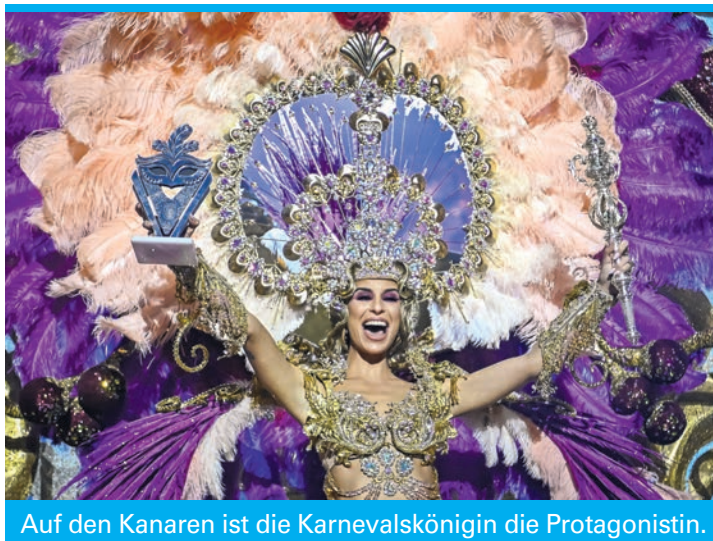
Auf den Kanaren ist die Karnevalskönigin die Protagonistin.

Die nächste Karnevalshochburg ist Águilas in der Region Murcia. Die spektakulären Umzüge – die großen finden dieses Jahr am 15., 17. und 21. Februar statt – locken jedes Jahr mehr Besucher an als die Kleinstadt Einwohner hat, und das ist kein Wunder: Die Kostüme sind farbenfroh, die Umzüge dauern mehrere Stunden, etliche Tanzgruppen zeigen, ebenfalls in aufwendigen Kostümen, ihr Können. Nicht von ungefähr ist der Karneval mittlerweile als Fiesta von internationalem touristischen Interesse ausgezeichnet.