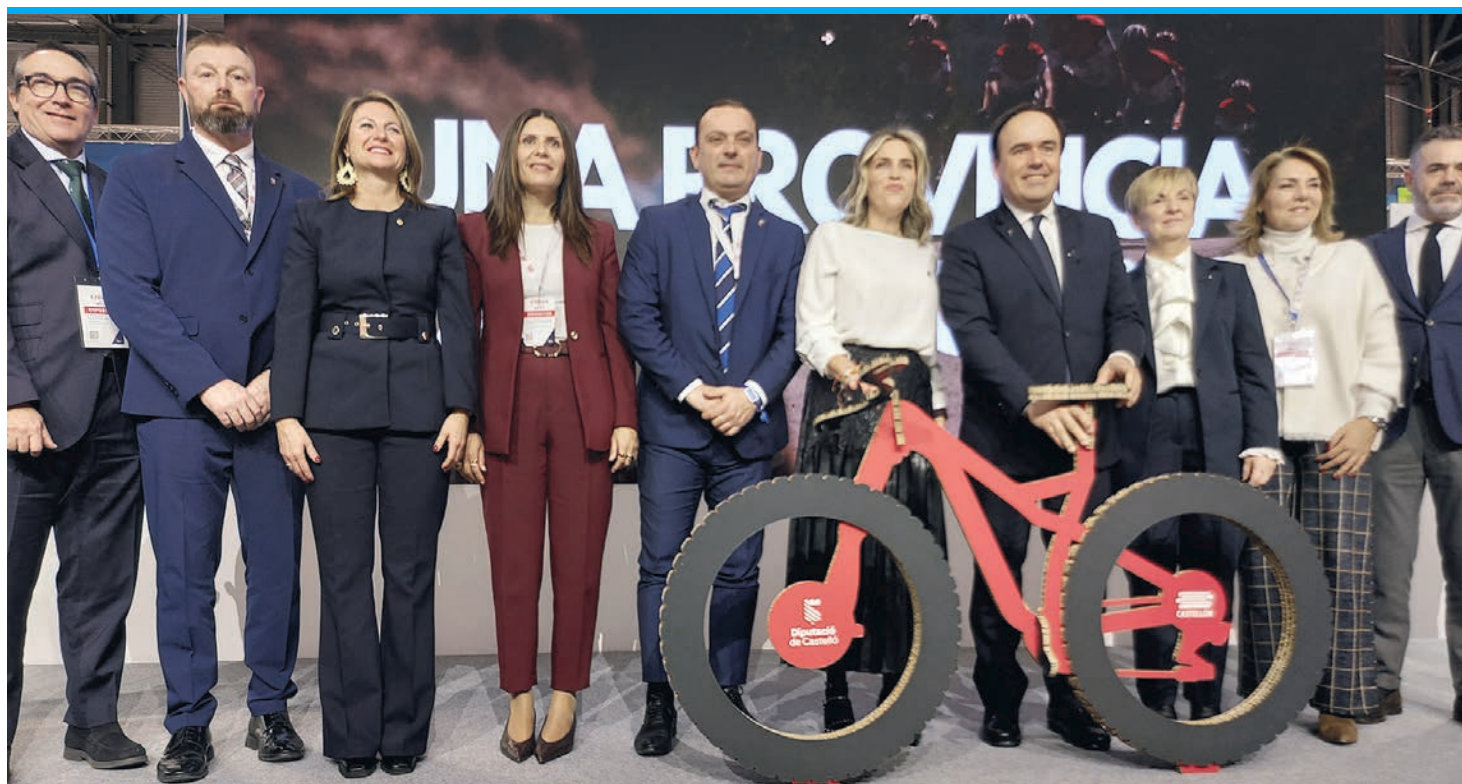
Die Region Valencia hat ihr Tourismusangebot bei der Messe Fitur in Madrid präsentiert.