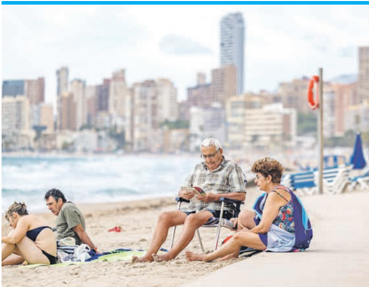
Renten sind nicht so sicher wie versichert.

Auch für Regionen und Kommunen bleiben Steuervorteile in der Schwebe. Und Arbeitslose müssen nun doch ihre Einkommensteuererklärung abgeben. Im Argen bleiben auch die Hilfgelder für persönliche Schäden bei Waldbränden, die Stärkung der Hilfslini-