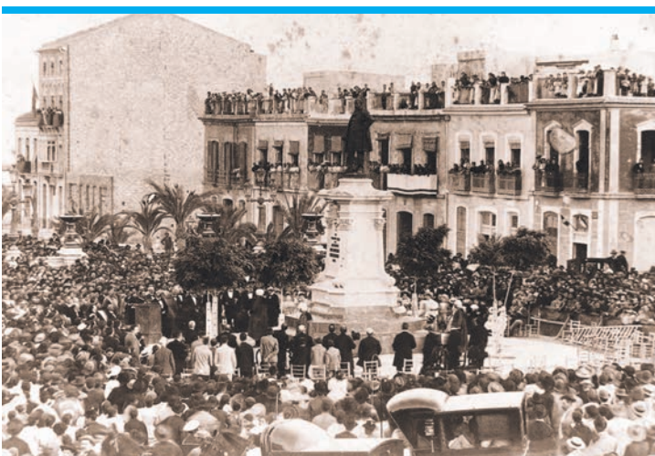
Einweihung des Maisonnave-Denkmalums um 1890.