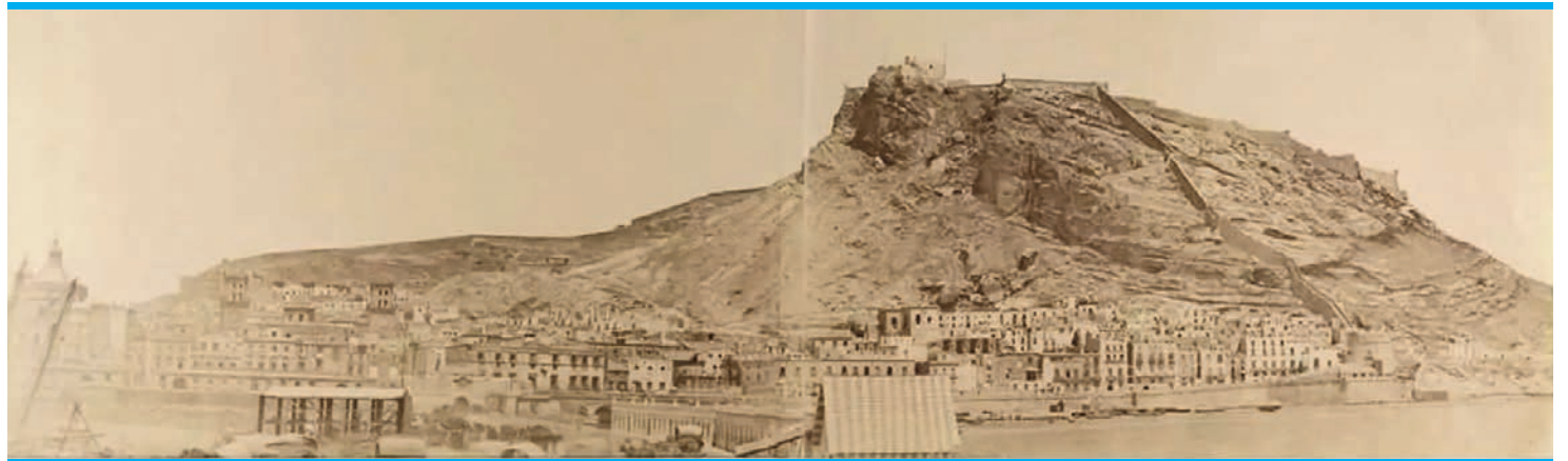
Ein Franzose machte 1858 dieses erste Panoramabild von Alicante.

Der berühmteste Bewohner dieses Palastes war übrigens ebenfalls eine Persönlichkeit, die Alicante maßgeblich geprägt hat