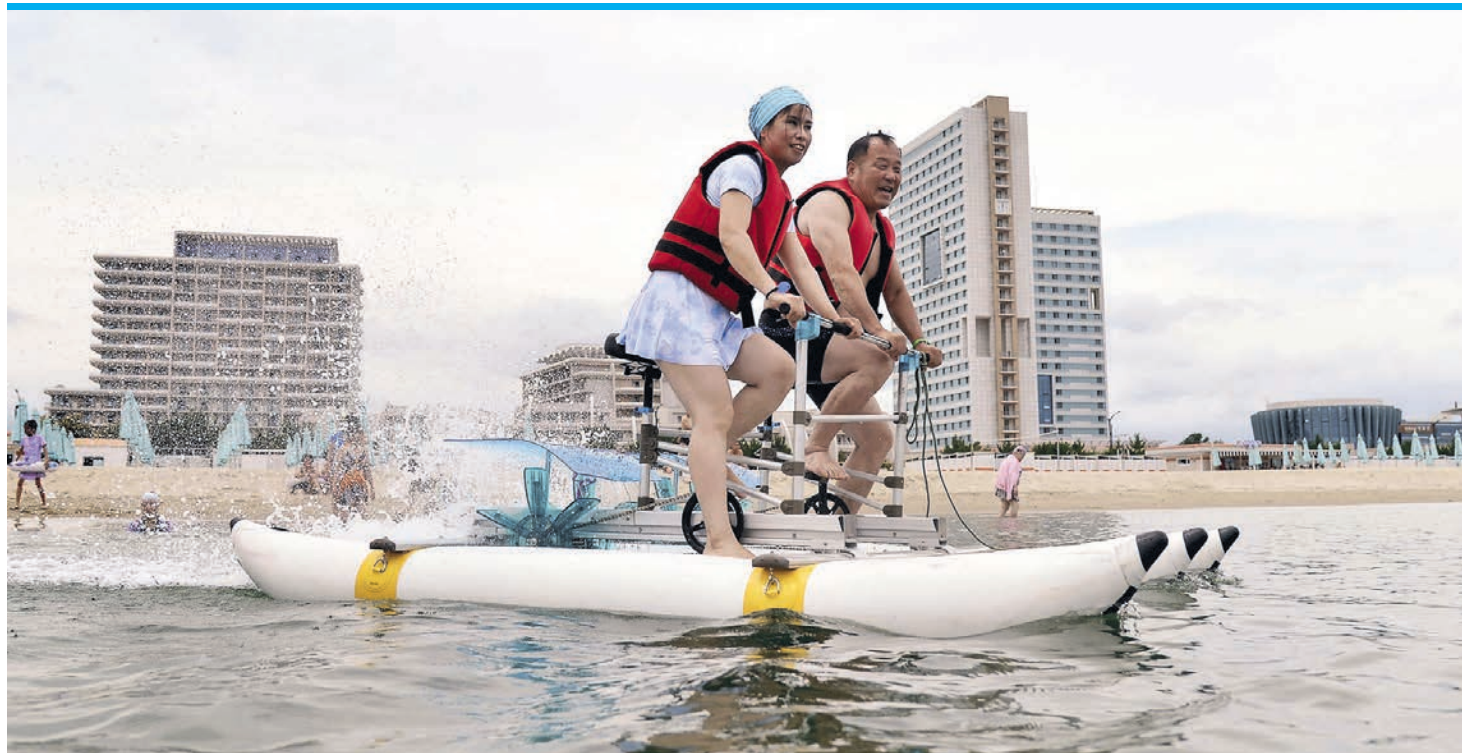
Noch hat die Promenade in Wonsan Kalma weniger Hochhäuser.