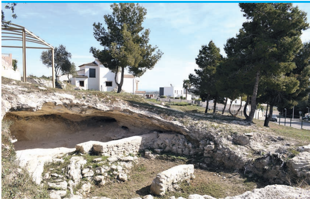
In der „Hexenhöhle“ wurden Reste verschiedenster Epochen gefunden.

Und zu dieser gehört unter anderem die Cova de Bruixes, die Hexenhöhle also, im Tossal de l'Abiar, in der schon seit dem Jahr 2000 immer wieder Archäologen graben und suchen. Die Höhle soll ein Versteck von Banditen und Schmugglern gewesen sein, der Name „Hexenhöhle“ rührt daher, dass sie, so