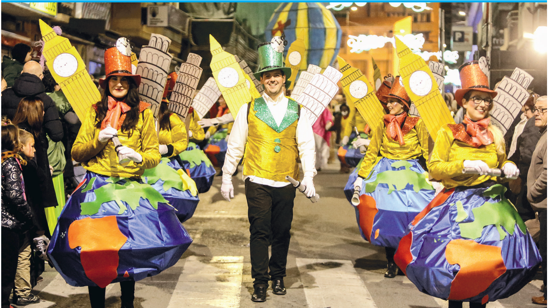
Die Umzüge beim spanischen Karneval gestalten geschlossene Gruppen, die sogenannten „comparsas“.