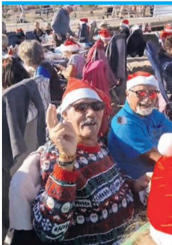
Auch in La Mata trifft man sich.