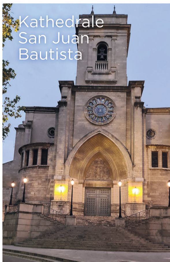
Kathedrale San Juan Bautista