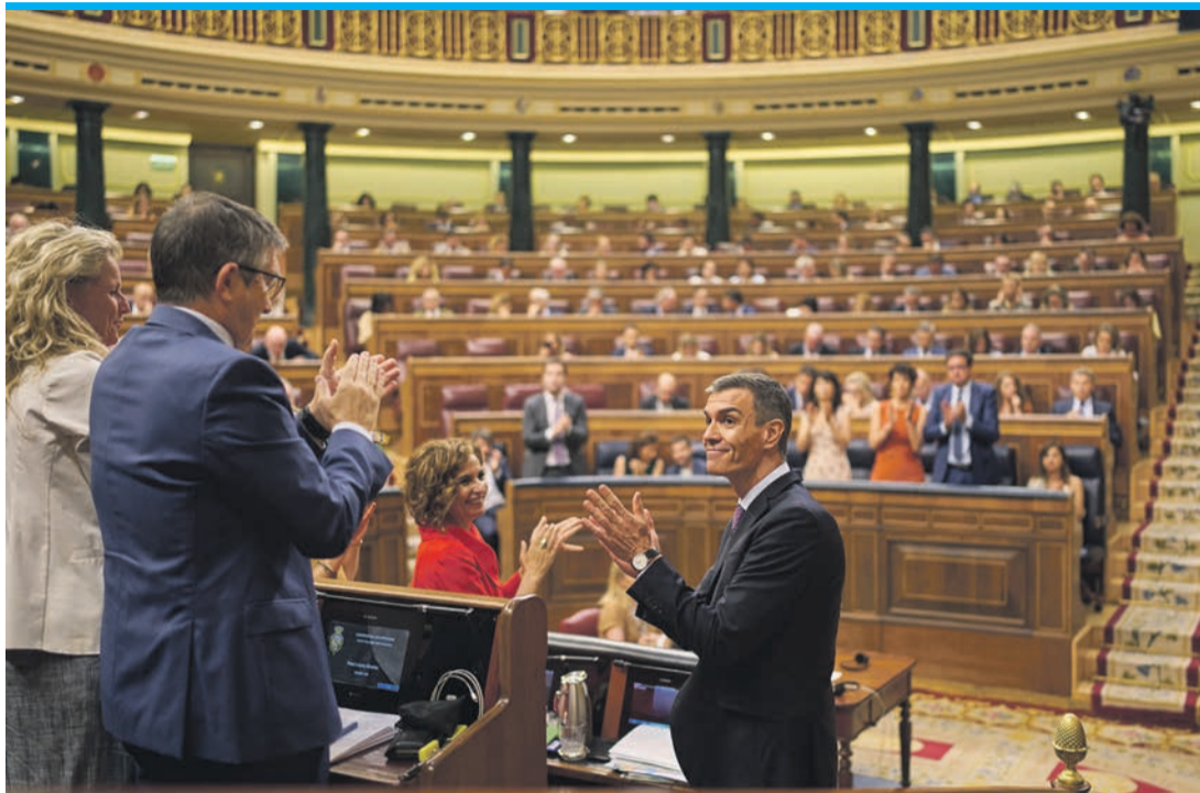
Ministerpräsident Pedro Sánchez denkt nichts an Aufhören.

Tatsächlich kann die Regierung Errungenschaften vorweisen. Auf dem Papier geht es dem Land blendend, im Vergleich zu früher oder zu einigen europäischen Nachbarn. Die Wirtschaft läuft, der Arbeitsmarkt entwickelt sich gut, Mindestlohn und Renten steigen und einige soziale Errungenschaften wie bei der Elternzeit kann die Regierung vorweisen. Sánchez fügt Fortschritte im Kampf gegen Häusliche Gewalt und gegen den Klimawandel sowie das Amnestiegesetz an. Und voran soll es auch im Januar mit einem Spanien-Ticket für 60 Euro für Regional- und Nahverkehr