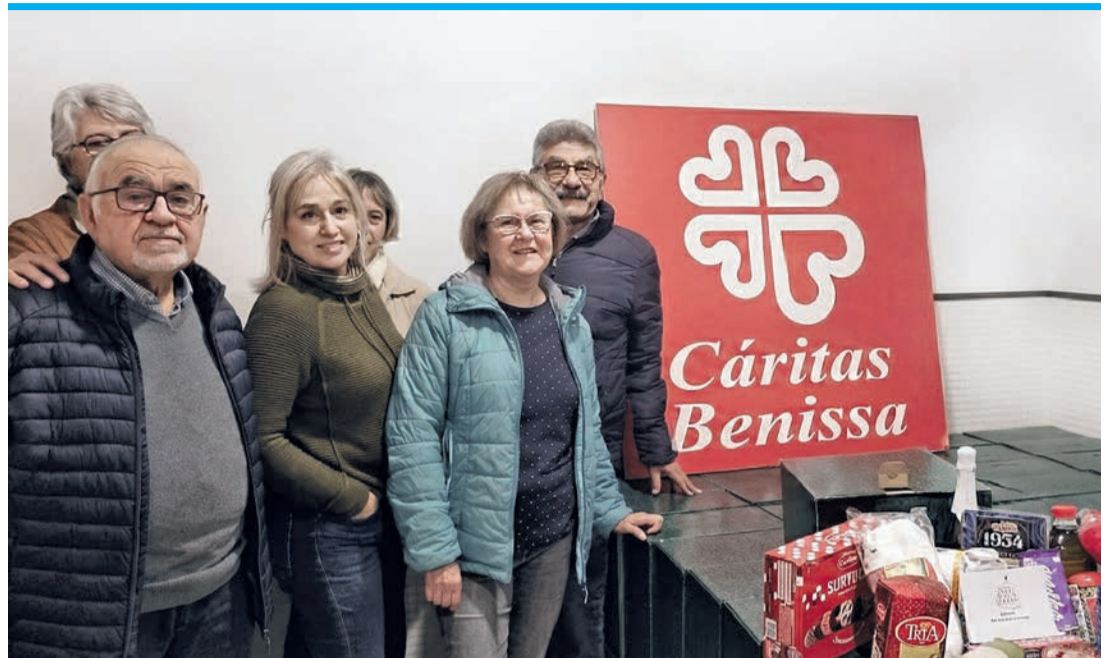
Spendenübergabe in Benissa.

Bereits zum zehnten Mal haben sich die Initiatoren zusammengetan, um Menschen in Not in der Marina Alta ein schöneres Weihnachtsfest zu bereiten. Bei Freunden, Bekannten und Familien sammelten sie Geldspenden, um daraus Lebensmittelpakete zu packen. Diese enthalten neben Grundnahrungsmitteln wie Olivenöl, Reis, Nudeln und Schinken auch eine Flasche Cava, einen Christstollen und Schokolade. „Kleine Gesten, die in schwierigen Zeiten viel bedeuten können“, sagen die drei guten Freunde aus Deutschland, die wie in den Jahren zuvor im Hintergrund bleiben wollen.