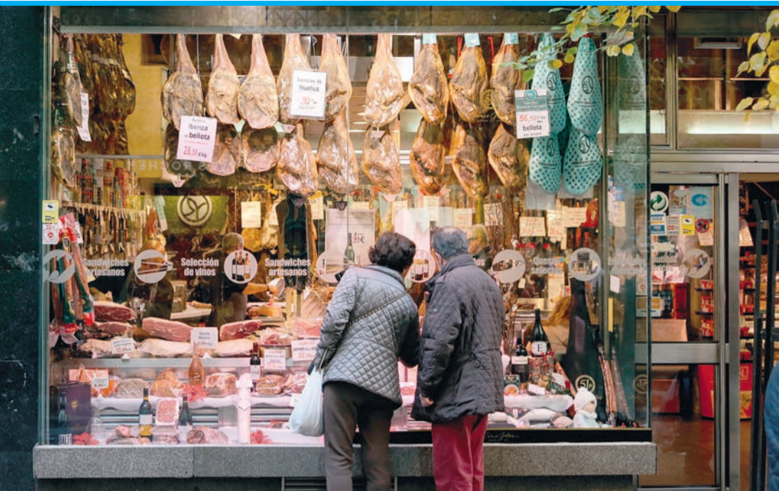
Immerhin, die Jamón-Preise sollen wegen der Schweinegrippe stabil bleiben.