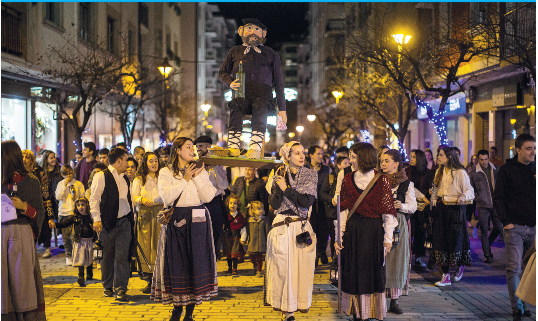
Der Olentzero bringt im Baskenland erst Geschenke, dann wird er verbrannt – aber immer gefeiert.