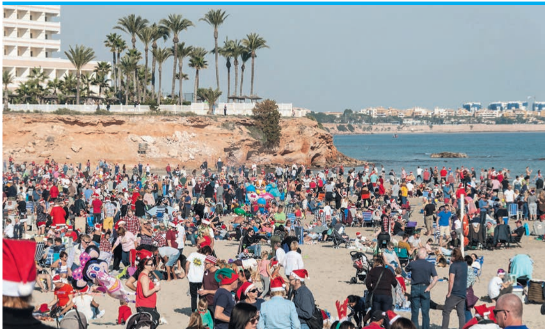
Zur Christmas Beach Party in La Zenia kommen Tausende.