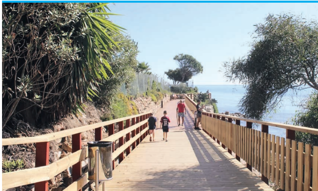
Abschnitt bei Estepona.

Denn oft überschneiden sich Zuständigkeiten zwischen Küstenamt (staatlich), Häfen (mā Landeszuständigkeit, bei Sporthäfen auch lokal, die Großen indes auch staatlich). Doch selbst eine lächerliche Holzbrücke von 27 Metern über ein Barranco (trockenes Flussbett) zwischen Benalmádena und Torremolinos konnte mitunter Jahre in Anspruch nehmen und einen siebenstelligen Betrag kosten, weil sich Rathaus 1 und 2 nicht grün waren und man –