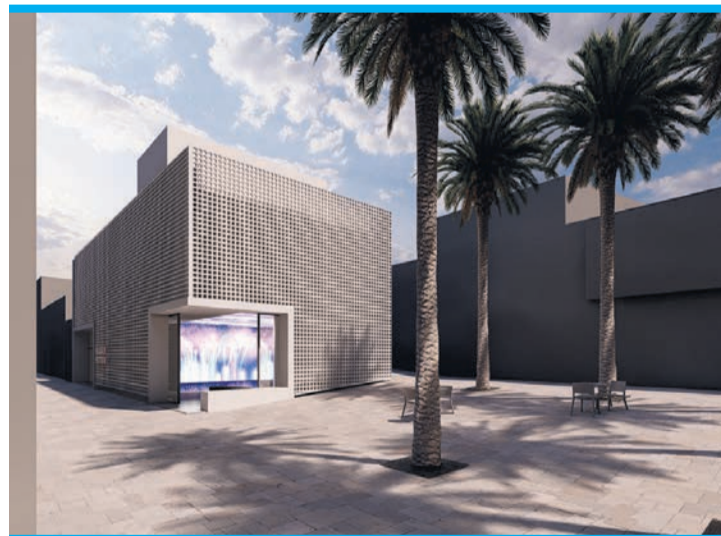
So soll das Museum aussehen.