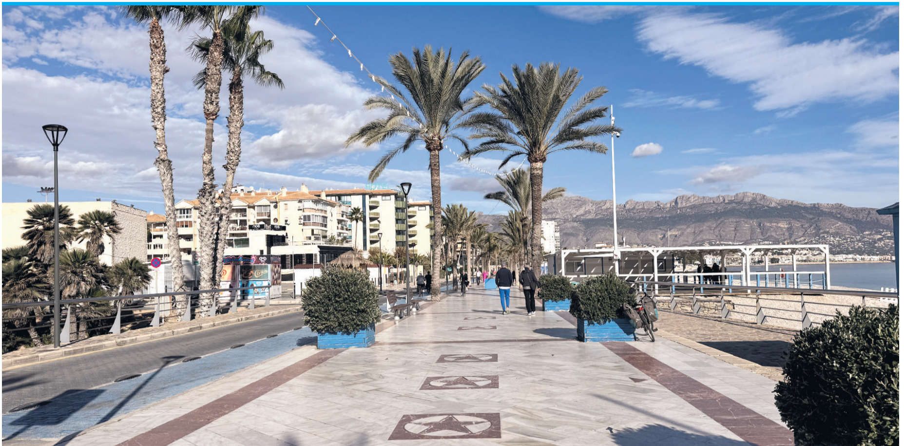
An der Costa Blanca gibt es schöne Küstenwege, wie von Altea nach Albir oder von Torrevieja bis nach Pilar de la Horadada.