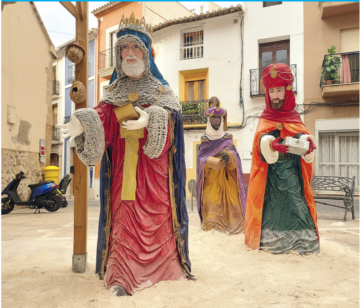
Manchmal kommen die Heiligen Drei Könige auf dem Roller angefahren – hier in Finestrat.

Nicht nur für Kinder ist es ein riesiger Spaß, auf Entdeckungsreise zu gehen, Bäcker beim Brotbacken zu beobachten, Müller beim Mehlmahlen und dann natürlich Josef, Maria und Jesus im Stall bis zu den Heiligen Drei Königen, die dem Neugeborenen ihre Geschenke bringen. Von klassischen Krippen mit teils historischen Figuren bis zu neumodischen Erfindungen mit Sand-Landschaften ist alles dabei – wir geben Tipps, welche beles an der Costa Blanca, in Valencia und Murcia besonders sehenswert sind.