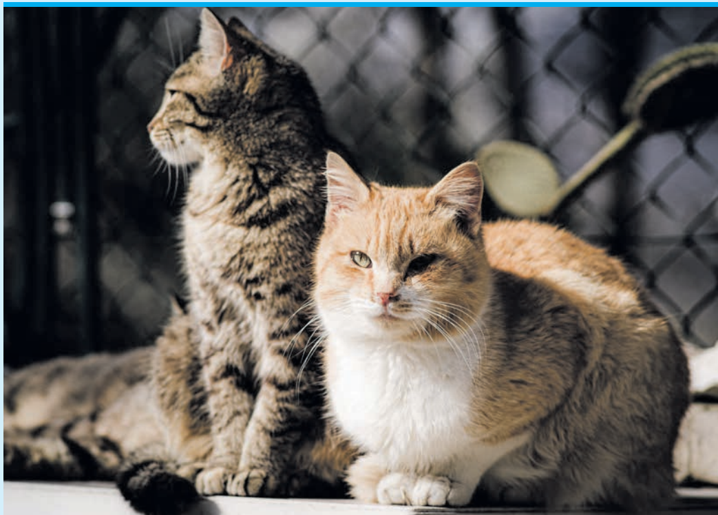
Die Katzenherberge La Palmera feiert Weihnachten zum Wohl der Katzen.

Sella – red. Die Katzenherberge La Palmera in Sella lädt zu einem gemütlichen Weihnachtskaffee und leckerem Kuchen am Samstag, 13. Dezember, ab 14 Uhr im Restaurante El Pantano ein. Der Erlös kommt den Katzen zugute. Das Restaurant befindet sich direkt am Stausee Amadorio, Avenida Europa 4, an der Landstraße CV-770 von Villajoyosa nach Sella, Kilometer 6,8. Weitere Infos unter: ☎ 608 961 170.