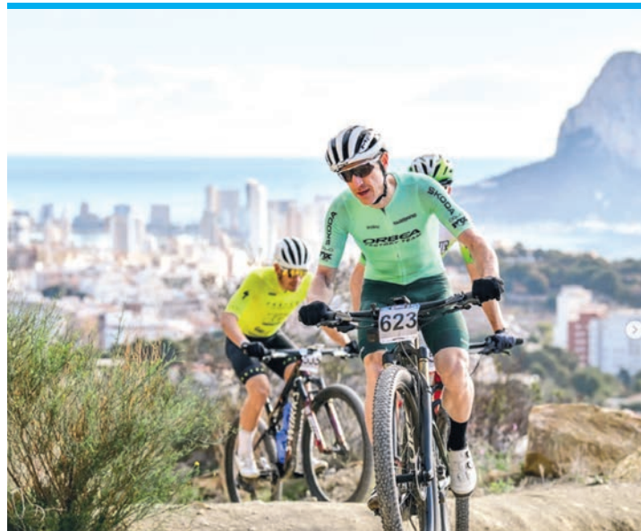
Ende Januar kommen die Biker wieder.

„Hier fährt man reines, technisches Mountainbike“, betont