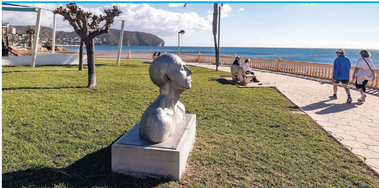
Augen schließen und in sich hinein spüren: „The Swimmer“ beim Platgetes-Strand.

Beginnen kann man die Tour, wo man will. In Moraira bietet es sich an, das Auto auf dem großen Senieta-Parkplatz am Ortseingang stehen zu lassen, sich im nahen Tourismusbüro eine Karte zu der Skulpturenroute plus einen Stadtplan aushändigen zu lassen und loszulaufen Richtung Meer – und zwar über die Avenida de la Paz. Hier sind es gleich zwei Köpfe, die auf den von schattigen Bäumen gesäumten, mit mehreren Bänken und einem kleinen Springbrunnen ausgestatteten Paseo platziert wur-