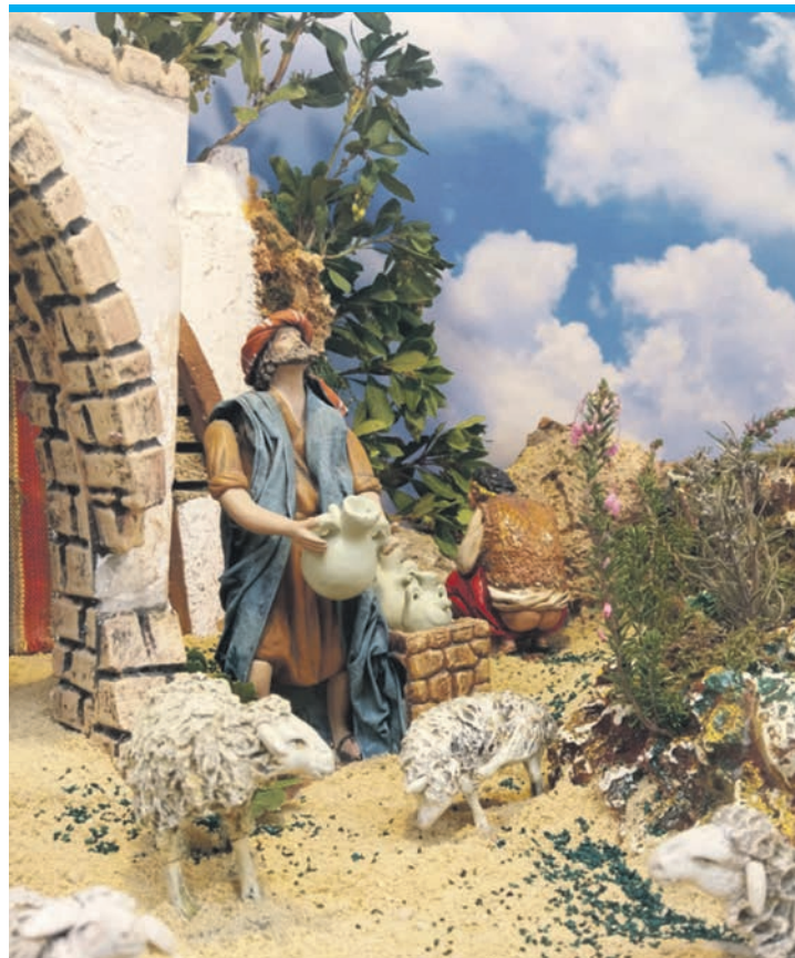
Spaniens kurioseste Krippenfigur: der „Caganer“ (Scheißerchen).

In Valencia kann man gut und gerne einen ganzen Tag damit verbringen, Krippen zu bestau- nen. Die valencianische Krip- penbauvereinigung hat im Kristallsaal des Rathauses wie- der eine monumentale Krippe aufgebaut, die mit allen klassi- schen Elementen daherkommt. Es gibt auch viele Alltagssze- nen, die auf die valencianische Kultur umgemünzt sind – etwa eine Frau, die die typischen sü-