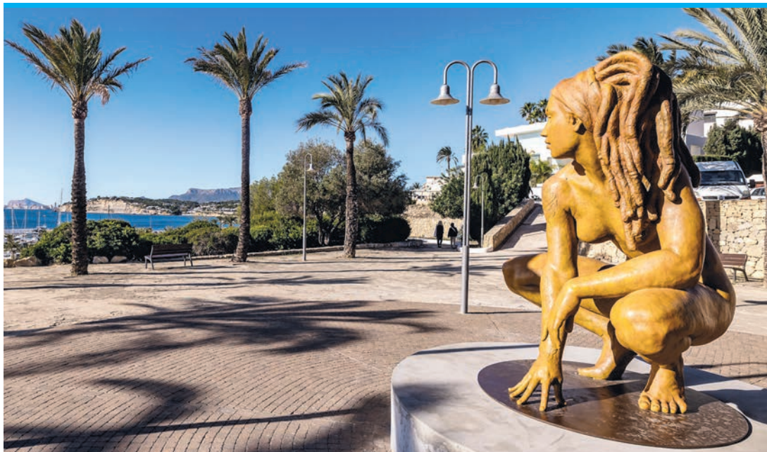
Pause auf dem Weg Richtung El Portet: „Walking in Beauty“

Auf dem grünen Gras ist es „The Swimmer“ von Coderch und Malavia, der sich in die Landschaft einfügt. Sein Richtung Meer gerichteter Blick lädt ein, abzuschalten und das Leben außerhalb dieses hübschen