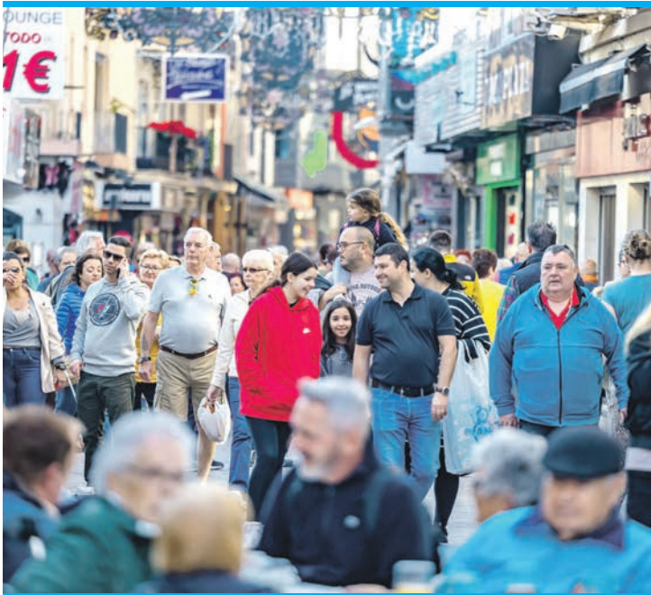
Benidorm ist ganz oben mit dabei.

Ihr Anteil liegt gut sechs Prozent über dem Vorjahreswert und ist überall mit Ausnahme der Region Extremadura gewachsen, vor allem Menschen aus Kolumbien – insgesamt 98.000 mehr – aus Venezuela (+52.550) und Marokko (+48.000) zog es nach Spanien, während Rumänen (-11.190),