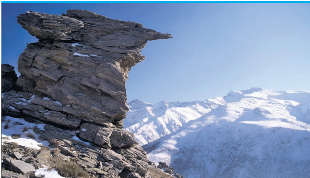
So schön bekommt die Sierra Nevada kein Skifahrer zu sehen.

Das Skigebiet Sierra Nevada, das drittgrößte Spaniens, wird von einem öffentlichen Unternehmen (Cetursa) betrieben, Eigentümer ist die Landesregierung von Andalusien, für die das Gebiet ein äußerst lohnenswertes Profit Center ist. Etwa drei Prozent Anteile hält die Stadt Granada. Umweltschützer, aber auch der Staat (für den Nationalpark zuständig) achten mit Argusaugen darauf, dass sich das Skigebiet nicht immer wei-