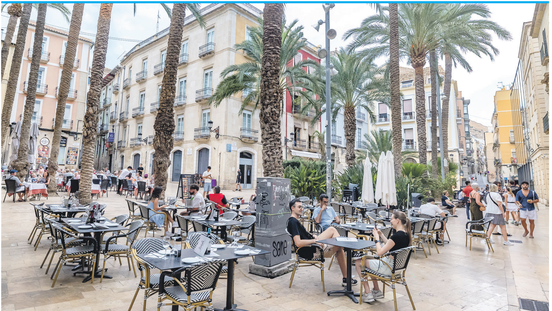
Restaurantbesuch im „El Barrio“, der Altstadt, hier direkt hinter dem historischen Rathaus.