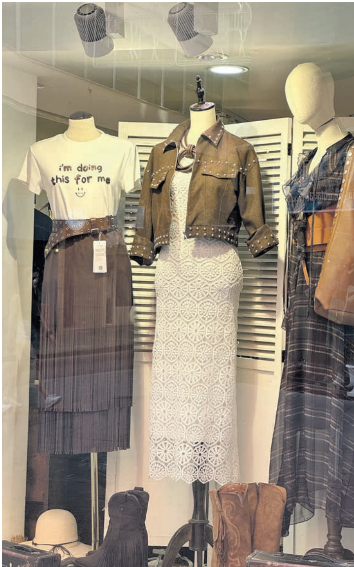
Der Boho-Trend in Alicante.

die Familie Espí schon seit 1890 ein Turrón-Geschäft und verkauft die Leckerei inzwischen zu jeder Jahreszeit. Das Sortiment umfasst unterschiedliche Sorten wie den knusprigen, harten Turrón de Alicante und den weichen Turrón de Jijona.