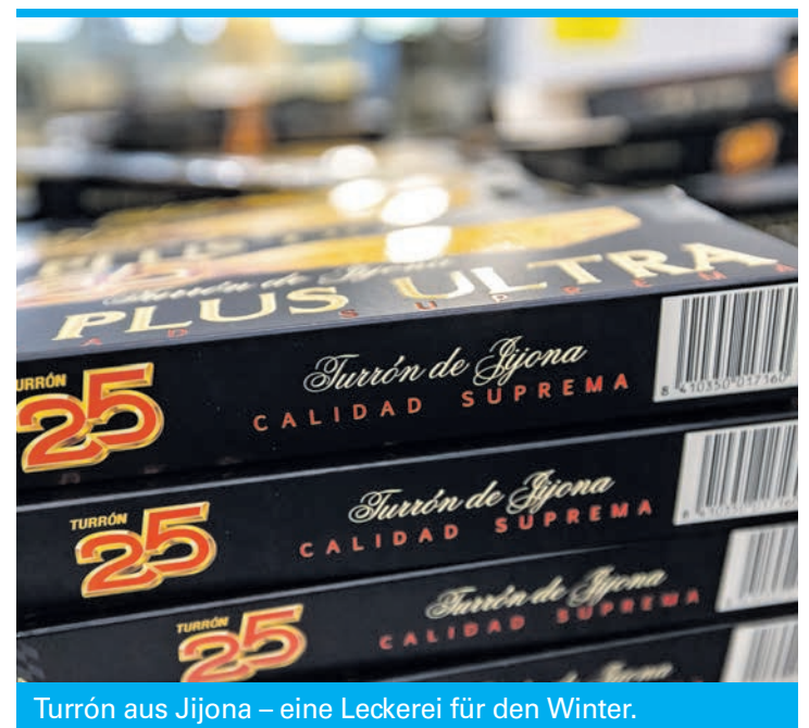
Turrón aus Jijona – eine Leckerei für den Winter.

Aus Alicante kommt auch der Turrón. Neben Jijona gilt die Stadt als eine der wichtigsten Produktionsstätten der Weihnachts-Süßigkeit aus gerösteten Mandeln, Zucker, Eiweiß und Honig. In der Calle Tomás López Torregrossa führt