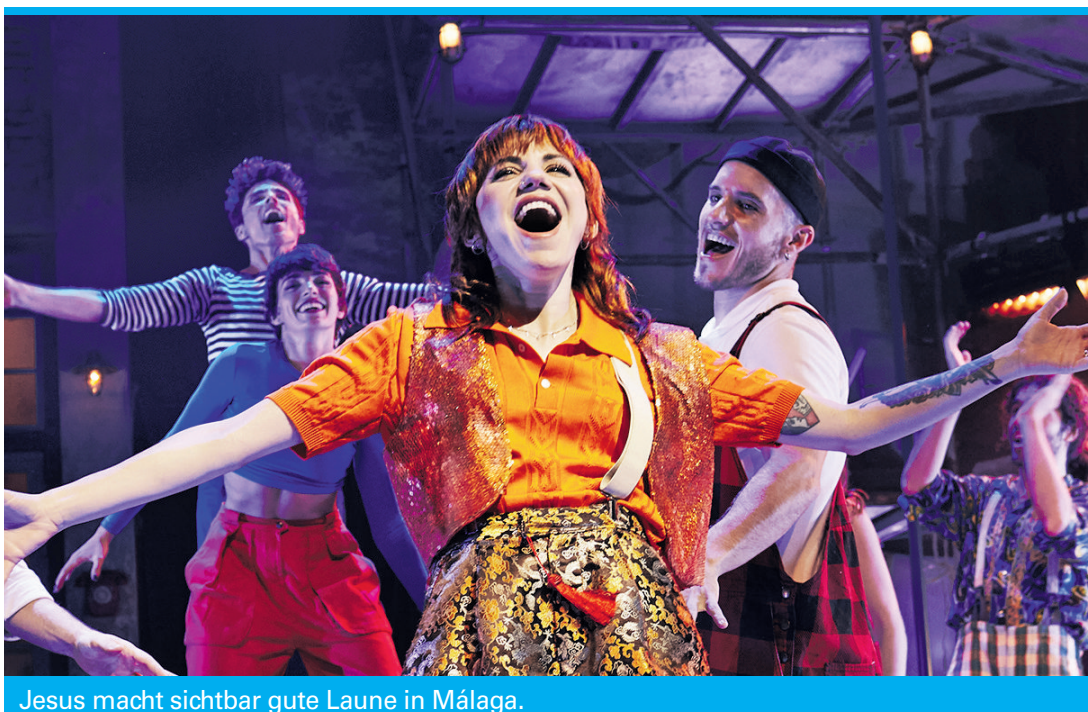
Jesus macht sichtbar gute Laune in Málaga.

Es geht um Toleranz, um Respekt vor dem Nächsten – auch wenn er „anders“ ist, es geht um Hilfe für Schwächere, um Werte, die sich nicht nur an Geld orientieren, um die Freiheit der Wahl, das Recht auf Scheitern und Neubeginn, das Recht auf Freude und ein angstfreies Leben. Also alles, was die Kirche predigt, den Gläubigen aber durch angebliche Beschränkungen vorenthält und Strukturen stützt, die eine gerechte Welt verhindern.