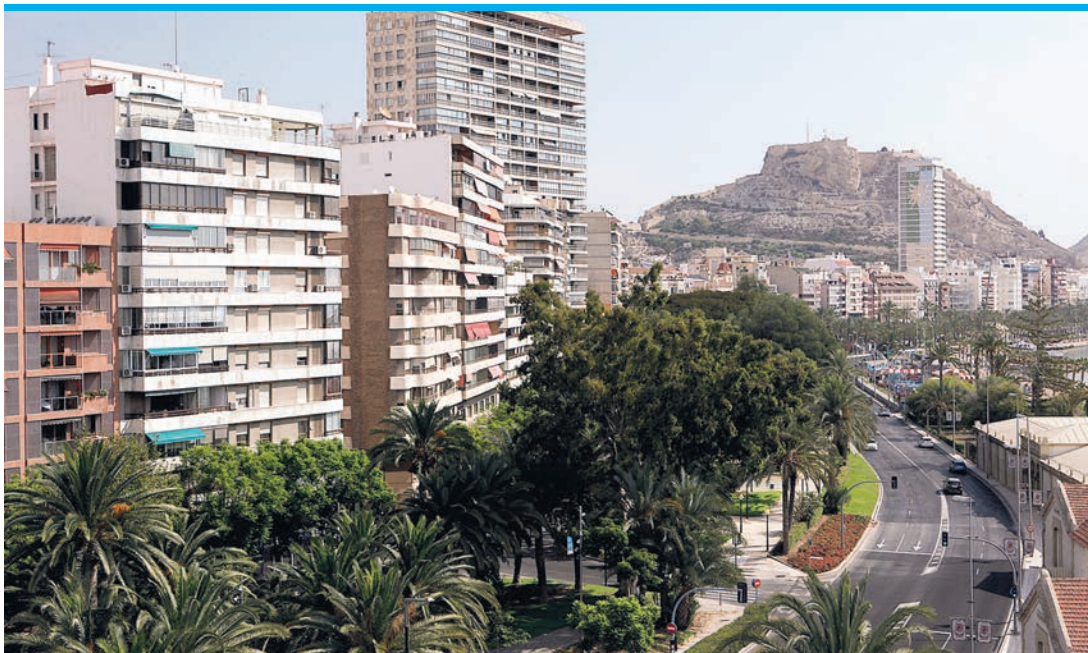
In Touristenstädten stiegen die Mieten extrem.