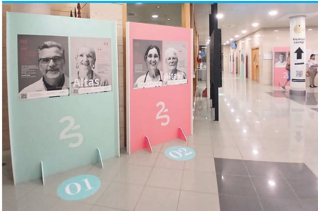
25 Jahre Quirónsalud: Ausstellung über Genesende .

So wurden im Quirónsalud erstmals in der Region Valencia Operationen mit dem Roboter Da Vinci durchgeführt oder Strahlentherapien mit moder-