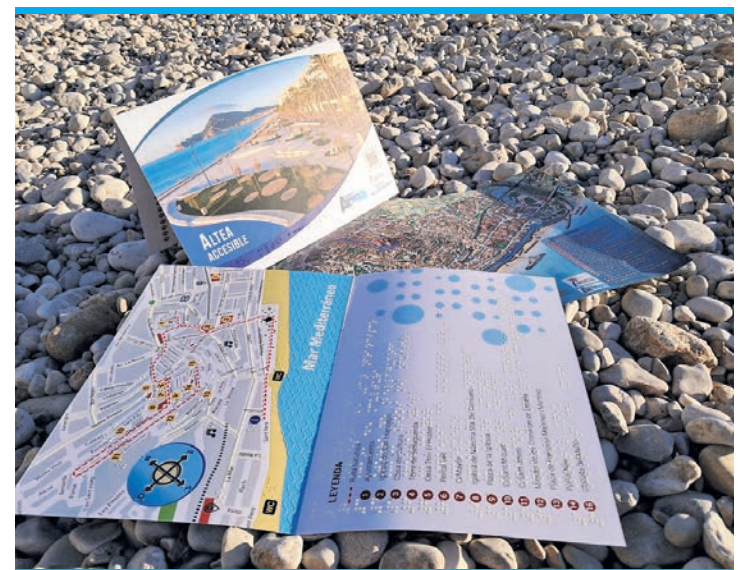
Karte mit Braille.

Erhältlich sind die neuen Karten in der Tourist Info, im