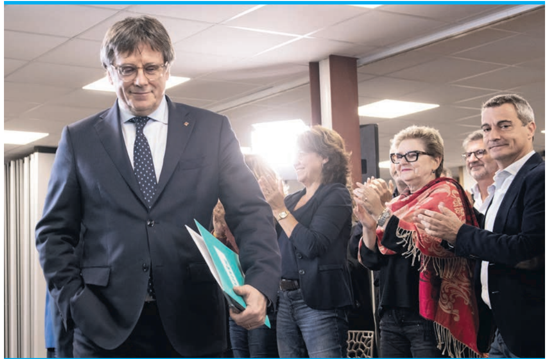
Carles Puigdemont steigt aus der Regierung aus, in der er gar nicht ist.

Dieses Abkommen zwischen PSOE und Junts, mit dem eigentlich die Amtseinführung von Pedro Sánchez für die Amnestie ausgehandelt wurde, steht schon seit geraumer Zeit auf sehr wackligen Beinen. Ohne die sieben Abgeordneten von Junts reichen aber die Stimmen all der anderen Regionalparteien wie ERC, PNV oder ERC in der Summe nicht aus, damit die Minderheitsregierung eine Mehrheit im Parlament zusammenkommt. Ob sich damit aber andere Szenarien wie Neuwahlen oder Misstrauensvotum auftun, steht keineswegs fest. An dem Credo