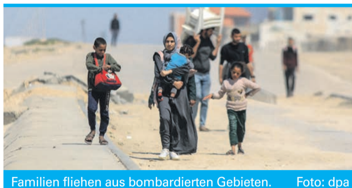
Familien fliehen aus bombardierten Gebieten.