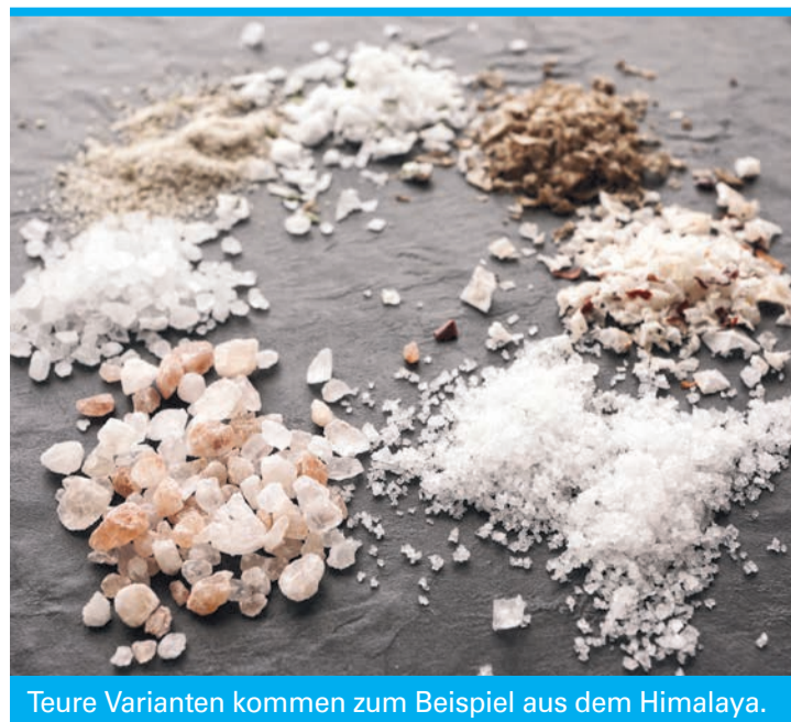
Teure Varianten kommen zum Beispiel aus dem Himalaya.

Jod ist ein lebensnotwendiges Spurenelement, das wichtig für eine normale Schilddrüsenfunktion ist. „Ein Erwachsener braucht im Schnitt 150 Mikrogramm Jod täglich“, so Wechsler. Jod kommt in Seefisch und Milchprodukten vor. Wer unter Jodmangel leidet, kann dies aber nicht allein mit jodiertem Speisesalz ausgleichen. Betroffene müssen dann nach Rücksprache mit ihrem Arzt Jodtabletten einnehmen. Spezialsalze aus fernen Ländern enthalten in der Regel kein Jod.