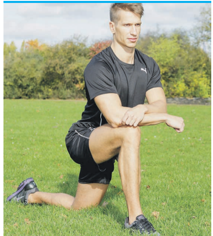
Den kalten Muskel sollte man nicht dehnen.

Generell sollte man nie den kalten Muskel dehnen. Nach ei-