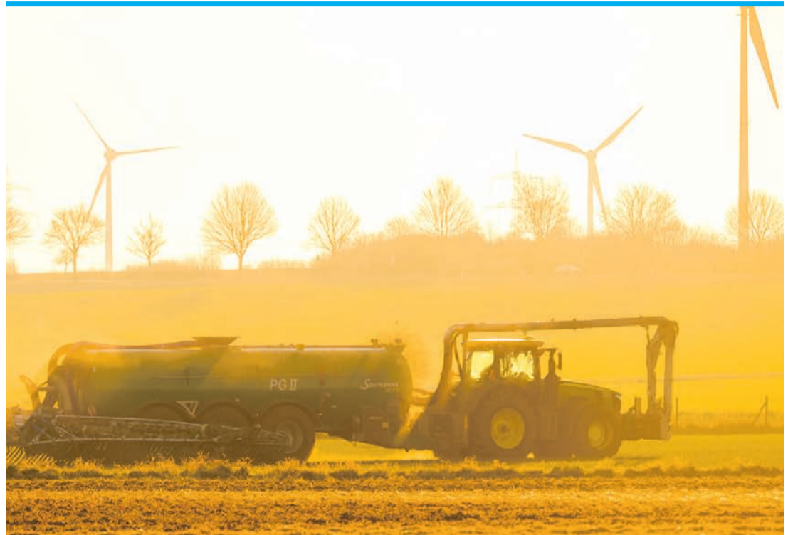
In Spanien gelangt viel Nitrat über die Landwirtschaft ins Grundwasser.

Die Landwirtschaft will davon nichts wissen. Dort müssen regelmäßig Wasserproben entnommen werden. Dies hätte in acht Gebieten auf den Balearen, in Madrid und Valencia passie-