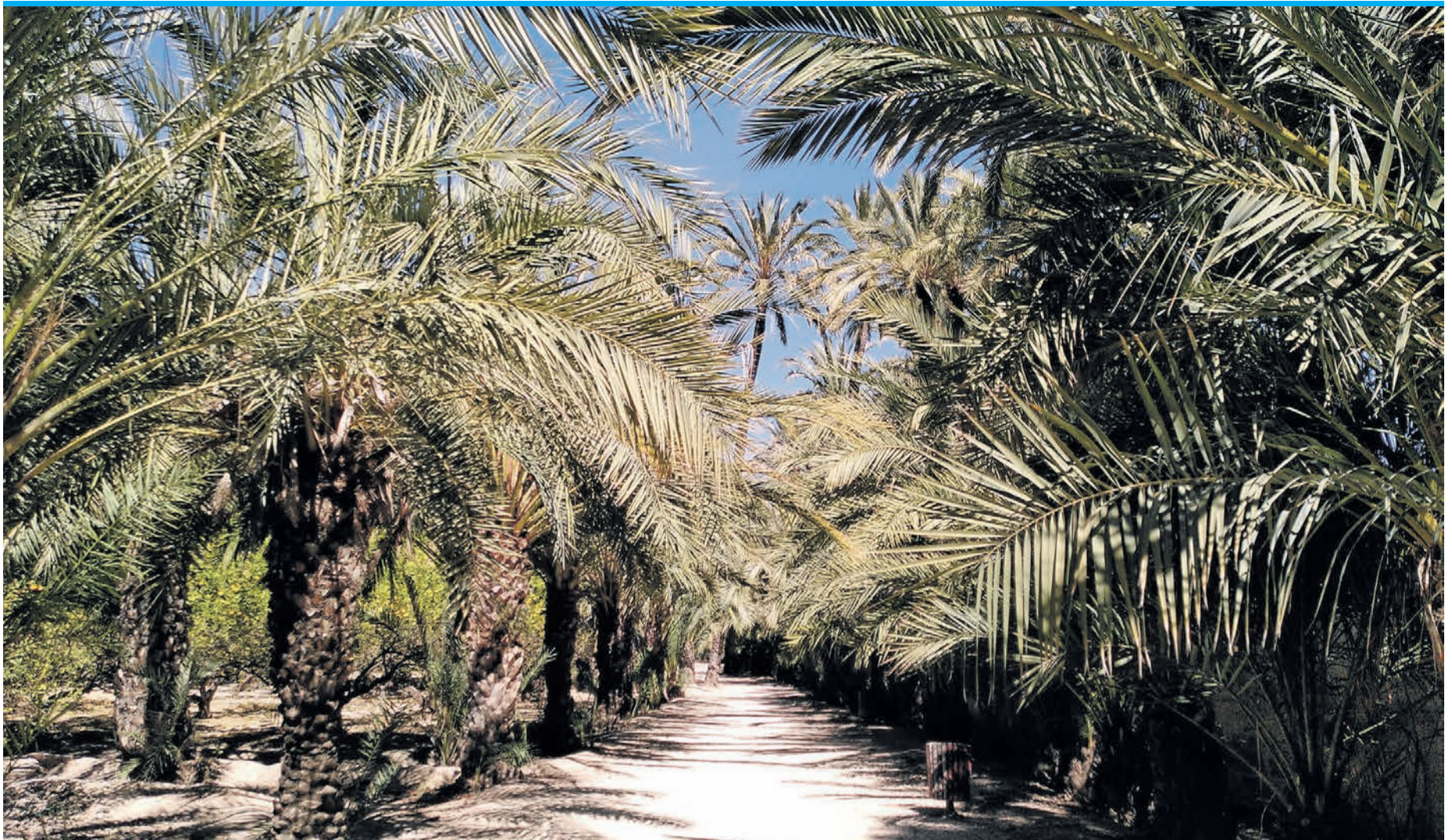
Die dichten Palmenhaine sind ein sehr beliebtes Fotomotiv für Besucher.