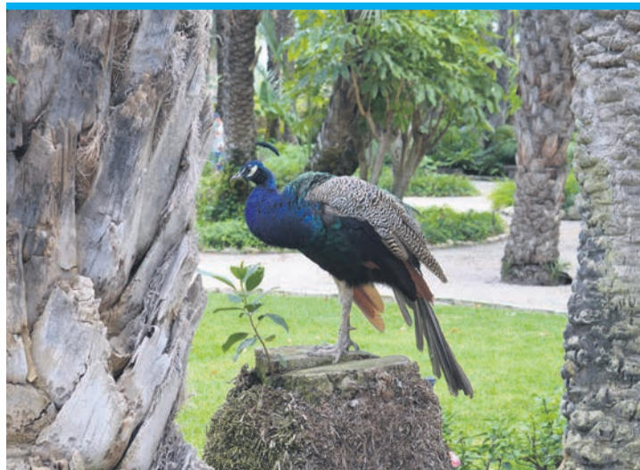
Auch Pfaue, Wasserschildkröten und Enten beleben den Park.

dabei natürlich wieder die obligatorische Ansammlung an Palmen unterschiedlicher Regionen. Kleine Wasserschildkröten und bunt gemusterte Enten bringen lautes Leben in das sonst so ruhige Palmenareal. Auch edle Pfaue ziehen um den Garten und posieren immer wieder in die Kamera, wenn sie können. Die Teichkulisse zählt zu den Highlights des Palmeral. Für eine Verschnaufspause stehen mit Ornamenten verzierte Bänke zur Verfügung. Leider ist die Traumkulisse doch nicht ganz perfekt: Der botanische Garten wird nur mit einem Zaun von lauten Straßen abgetrennt, was die idyllische Atmosphäre etwas beeinträchtigt.