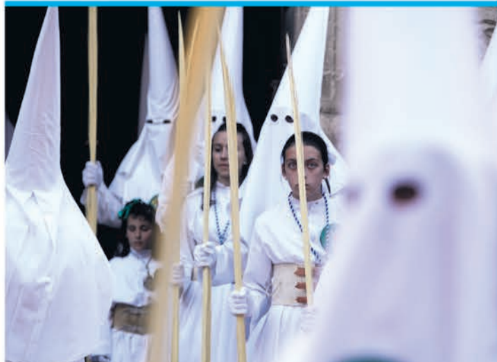
Zumindest einer unter den Kapuzen war im Knast.