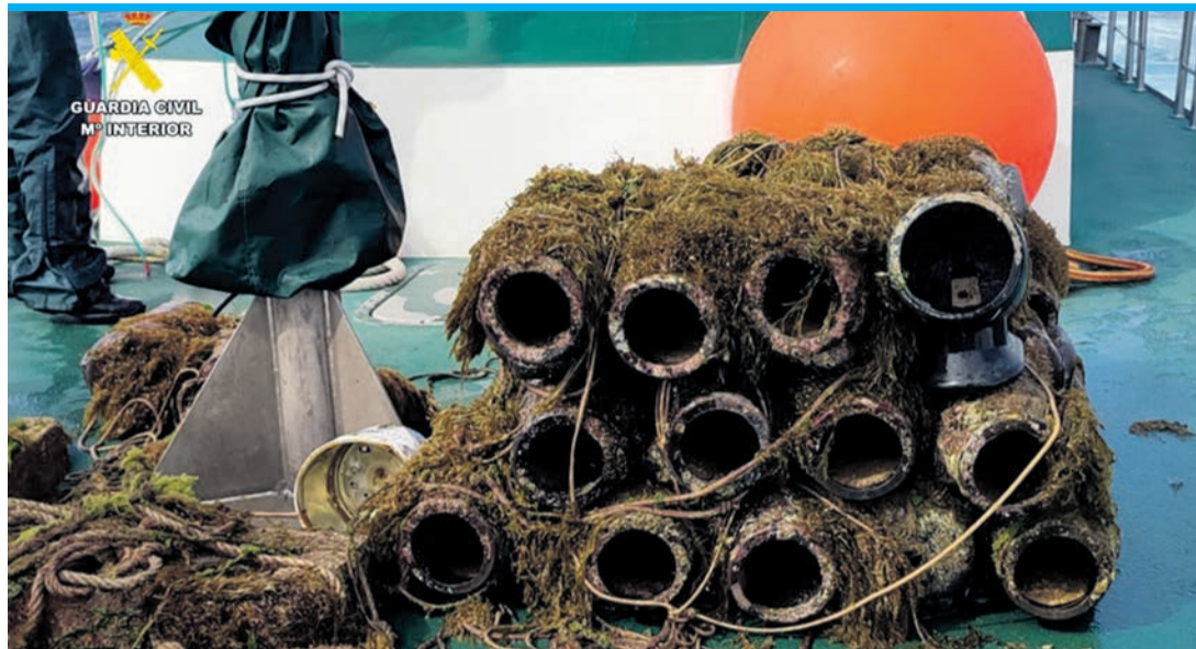
Illegale Fallen gaukeln Kraken | Unterschupf vor.

Doch die Meerestiere dürfen nur mit einer Genehmigung, die keiner der Taucher vorweisen konnte, gefangen werden und