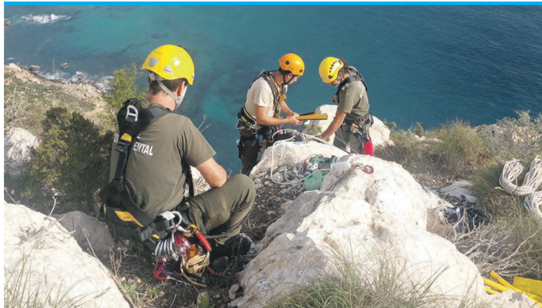
Pflanze für Pflanze wurde an steinigten Abhängen gezählt und registriert.

Die Silene de Ifach ( Silene hifacensis ) ist eine nördlich von Alicante endemische Pflanze, die unter anderem an ihrem Namensgeber, dem Peñón de